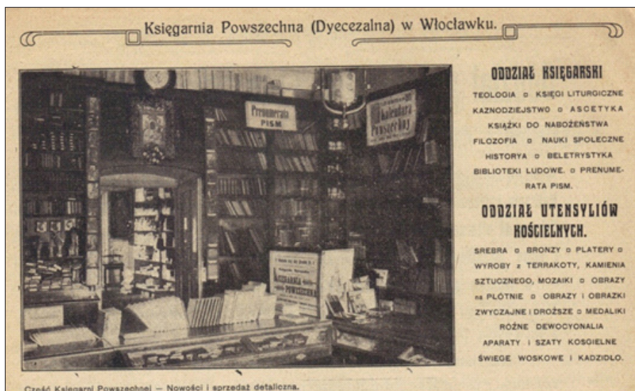
Ilustracja 2. Wnętrze księgarni z 1913 r.