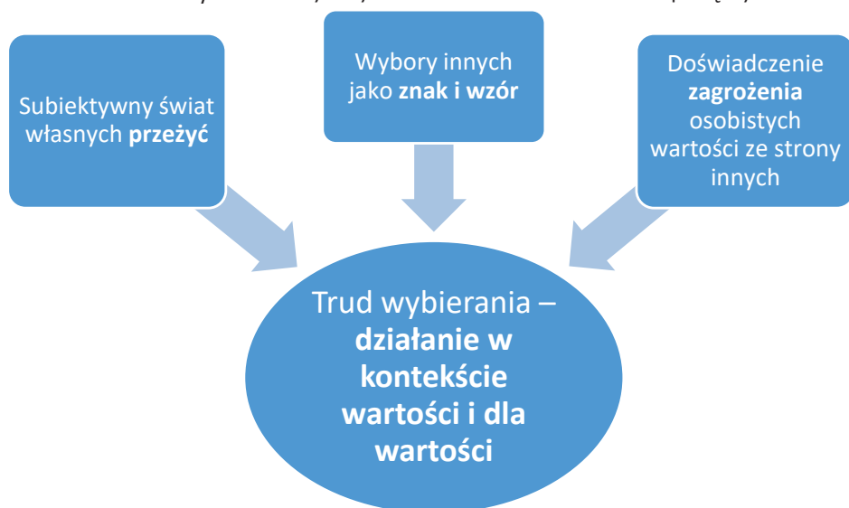
Ryc. 2. Różne wymiary doświadczania wartości i zależności pomiędzy nimi

Zależności pomiędzy wyodrębnionymi sposobami doświadczania wartości wydają się być wyraźne, realizacja wartości dokonuje się głównie w wyborach i będących ich naturalną konsekwencją działaniach. A te wypływają z subiektywnego świata przeżyć i refleksji, inspirowanego szeroko rozumianym działaniem innych, zarówno pozytywnym (znak, przykład, świadectwo), jak i negatywnym, odczytywanym jako zagrożenie dla wartości (por. Ryc. 2).