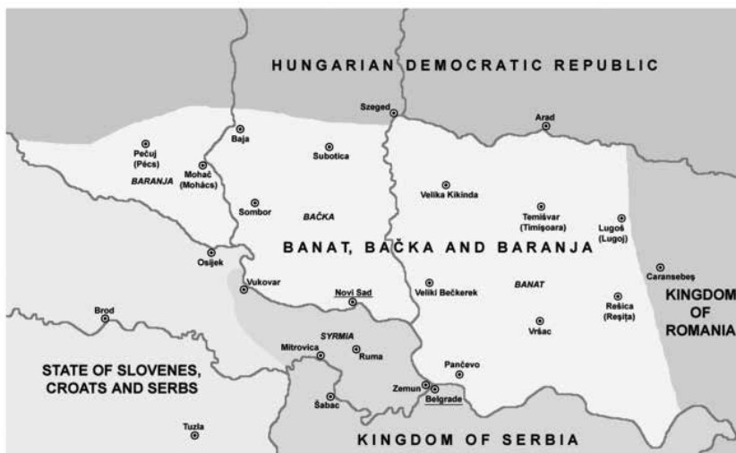
Mapa 3. Barania, Baczka i Banat zajęte przez wojsko Królestwa Serbii 25 listopada 1918 r.

Political situation in November 25, 1918: