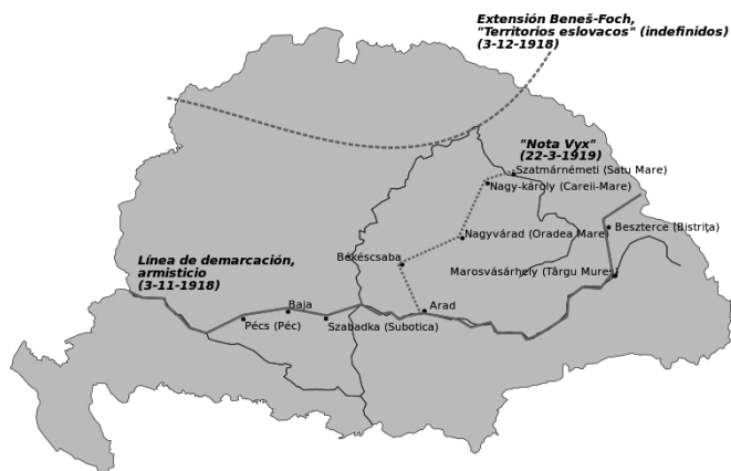
Mapa 4. Linie demarkacyjne na Węgrzech po I wojnie światowej

(Ciągła ustalona na podstawie aktu kapitulacji Austro-Węgier z 3 listopada, przekazana Węgrom 9 listopada i zapisana w porozumieniu z 13 listopada 1918 r.)