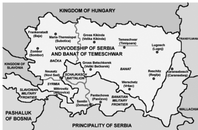
Mapa 1. Prowincja Wojwodina i Banat 1848-1860

Wschodni Śrem został przyłączony do już istniejącego węgierskiego komitatu Szerém ze stolicą w Vukovarze.