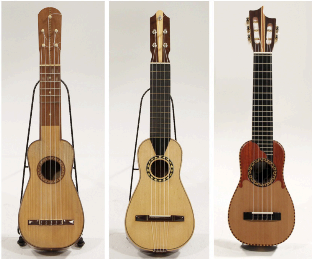
Il. 1 Timples de diferentes características y épocas

Actualmente, su desarrollo constructivo sigue siendo artesanal y todo el peso de investigación, mejoras y enseñanza de las técnicas de construcción del instrumento a las nuevas generaciones recae sobre los luthiers. La mayor parte de los luthiers que trabajan en el archipiélago se han formado de manera autodidacta a base del método ensayo - error, sin otra referencia previa que el oído y su propio criterio acústico. Por suerte, en la última década se ha potenciado la formación de estos artesanos mediante cursos públicos de inscripción libre y talleres organizados por iniciativas privadas.