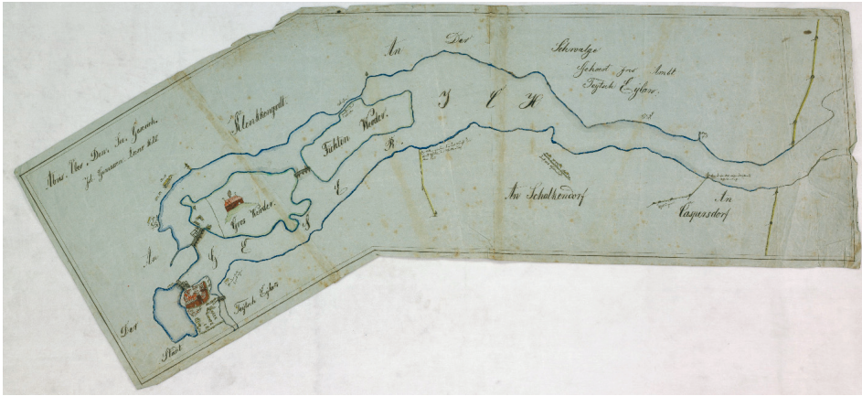
Ryc. 2. Łława wraz z okolicznymi miejscowościami i zamkiem na wyspie Wielka Żuława; XVIII wiek(?). Najprawdopodobniej przerys planu z 1620 roku (wg Lasek, Przytkowski 2013)