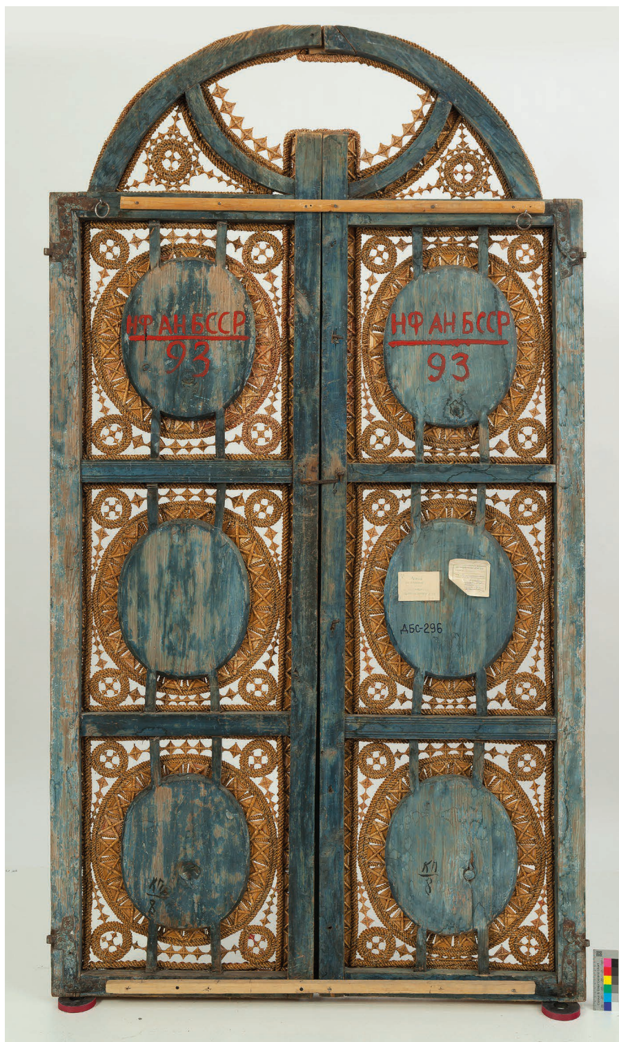
Il. 7. Druga strona carskich wrót ze wsi Wawulicze, powiat drohiczyński, obwód brzeski, 1835 rok; słoma, blejtram z drzewa sosnowego, tkanina, malowanie na desce, wyplatanie, 205 x 120 x 5 cm. Narodowe Muzeum Sztuki Republiki Białoruś, fot. Dzmitry Kazłow [Дзмітры Казлов].