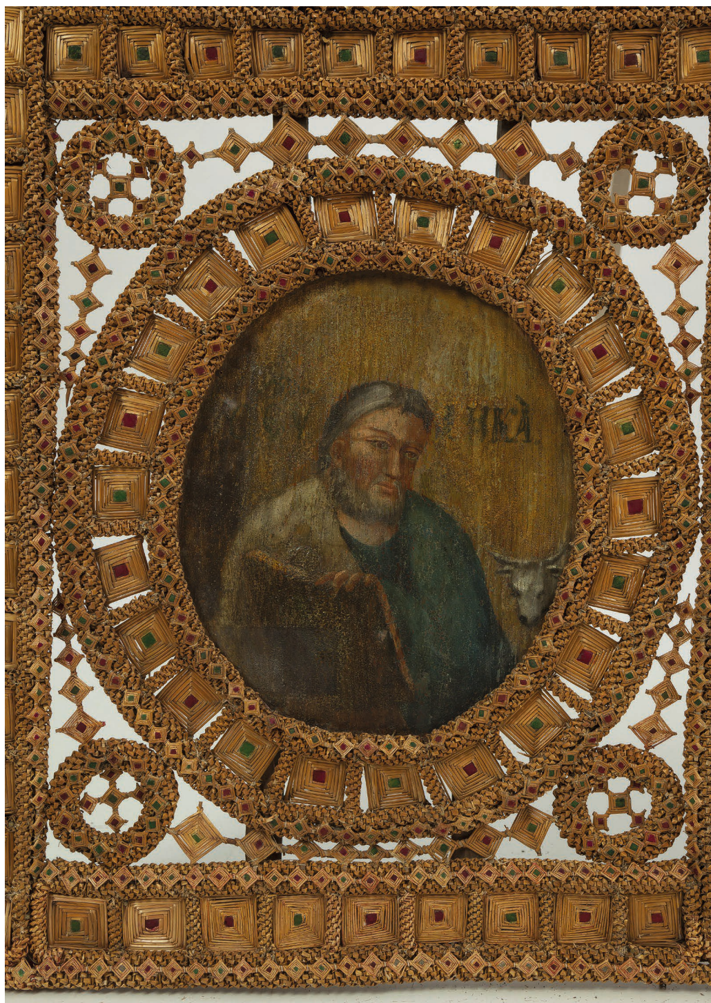
Il. 5. Ewangelista Łukasz. Fragment carskich wrót ze wsi Laskowicze, powiat iwanowski, obwód brzeski; drewno, farby terpentynowe, malarstwo. Państwowe Muzeum Historyczno-Archeologiczne w Grodnie, fot. Georgij Lichtarowicz [Георгій Ліхтаровіч].