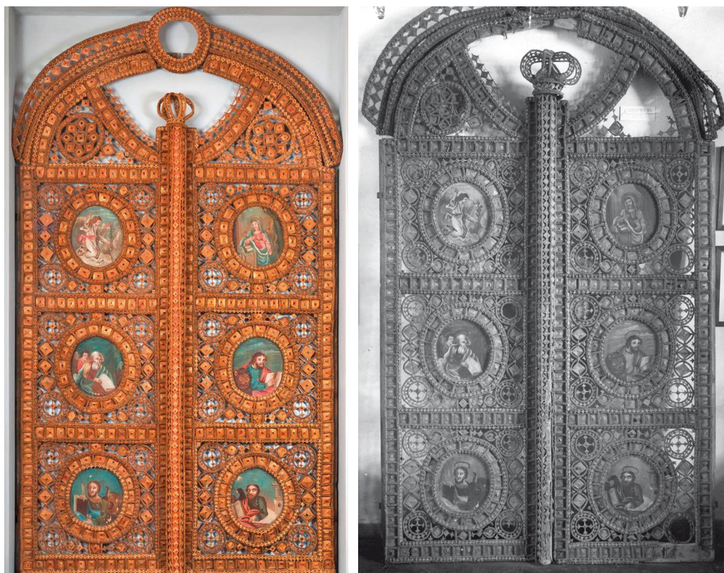
Il. 1. Carskie wrota carskie z ikonostasu w cerkwi p.w. Narodzenia Matki Boskiej we wsi Laskowicze, powiat iwanowski, obwód brzeski, 1836 rok; słoma, wyplatanie, drewno, malarstwo, 142 x 250 cm. Państwowe Muzeum Historyczno-Archeologiczne w Grodnie, fot. Georgij Lichtarowicz [Георгій Ліхтаровіч].