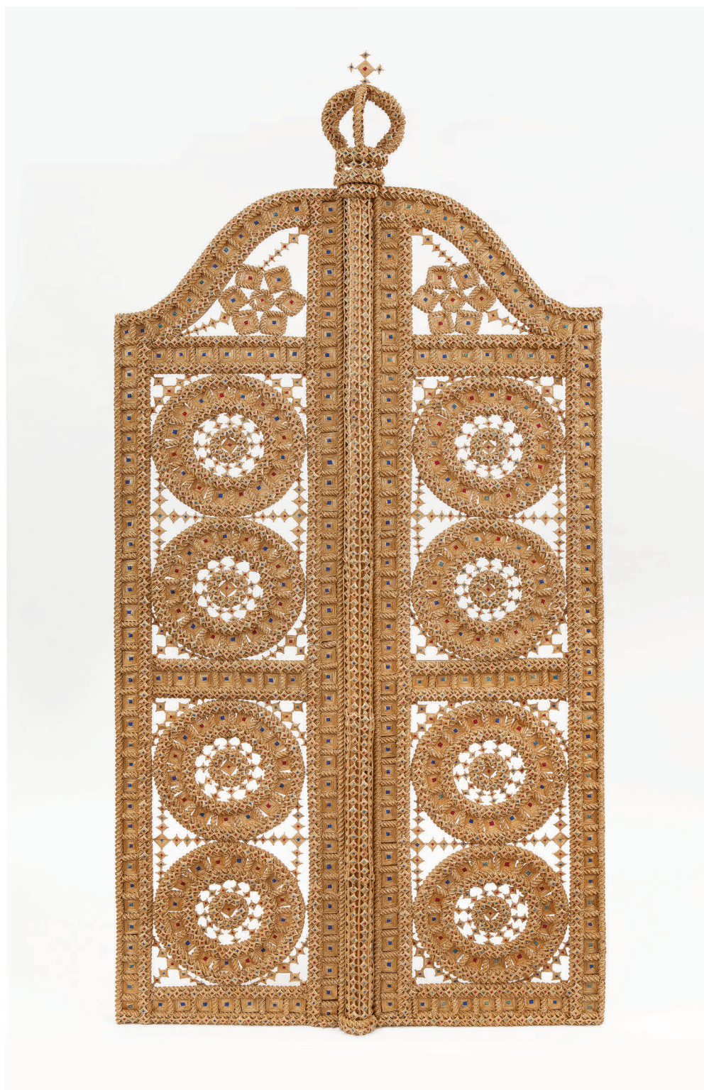
Il. 9. Kopia carskich wrót ze wsi Lemieszewicze, powiat piński, obwód brzeski, 2006 rok; autorka Larysa Łoś. Narodowe Muzeum Sztuki Republiki Białoruś, fot. Dzmitry Kazłow [Дзмітры Казлов].