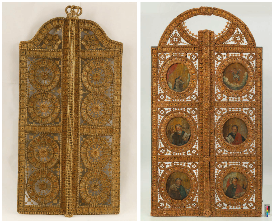
Il. 3. Carskie wrota ze wsi Lemieszewicze, powiat piński, obwód brzeski, 1810 rok (?); słoма, drewno lipowe, nić lniana, jedwab, aksamit, wyplatanie, 210 x 110 x 10 cm. Narodowe Muzeum Sztuki Republiki Białoruś.