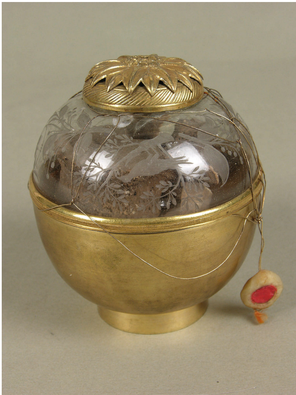
Il. 4. Zaplombowana urna kryształowa z relikwiami Bolesława Chrobrego