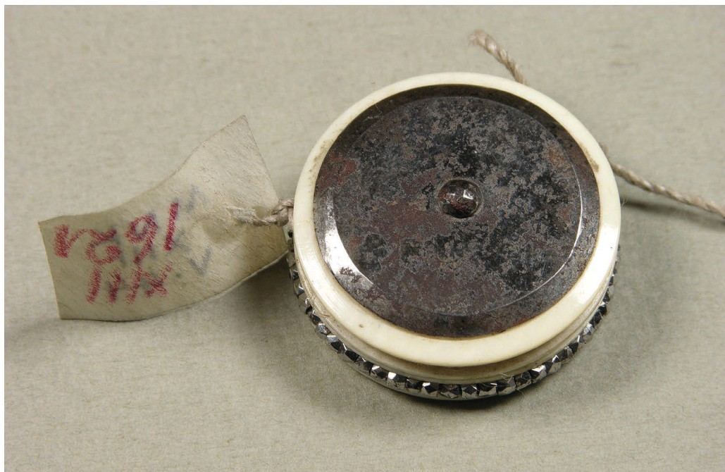
Il. 5. Puntały wg tradycji „po Stefanie Batorym”