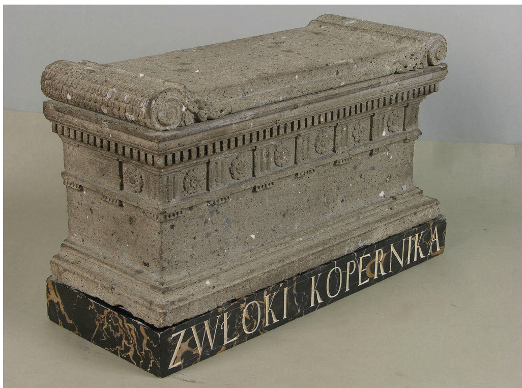
Il. 1. Sarkofag, wg tradycji ze szczątkami Mikołaja Kopernika