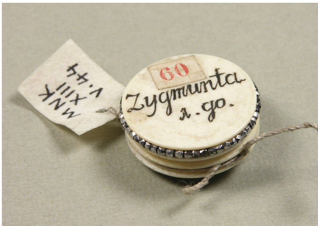
Il. 6. Puzderko z kości, z włosami króla Zygmunta I