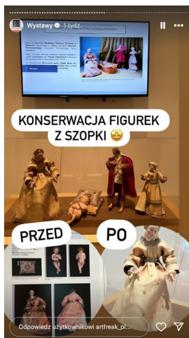
Ilustracja 2. Przykład relacji na Instagramie Art Freak