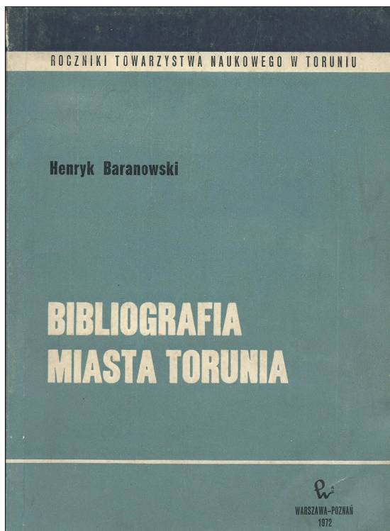
Ilustracja 2. Okładka Bibliografii Miasta Torunia [T. 1]. Warszawa–Poznań 1972.