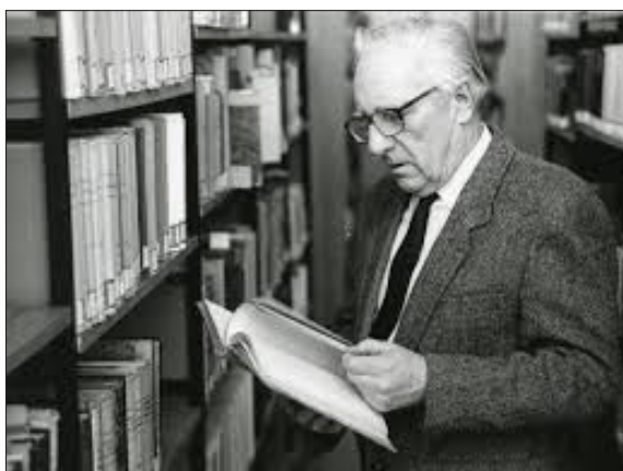
Ilustracja 1. Henryk Baranowski

dotyczące zagadnień pomorzoznawczych i bałtoznawczych. Dzięki swoim wysiłkom i zabiegom nie tylko zgromadził cenny księgozbiór, pozwalający uczonym na prowadzenie wielopłaszczyznowych badań naukowych, ale też przyczynił się do powstania w 1975 r. Czytelni Pomorzoznawczej, która stała się miejscem pracy wielu uczonych europejskich, reprezentujących rozmaite dziedziny wiedzy.