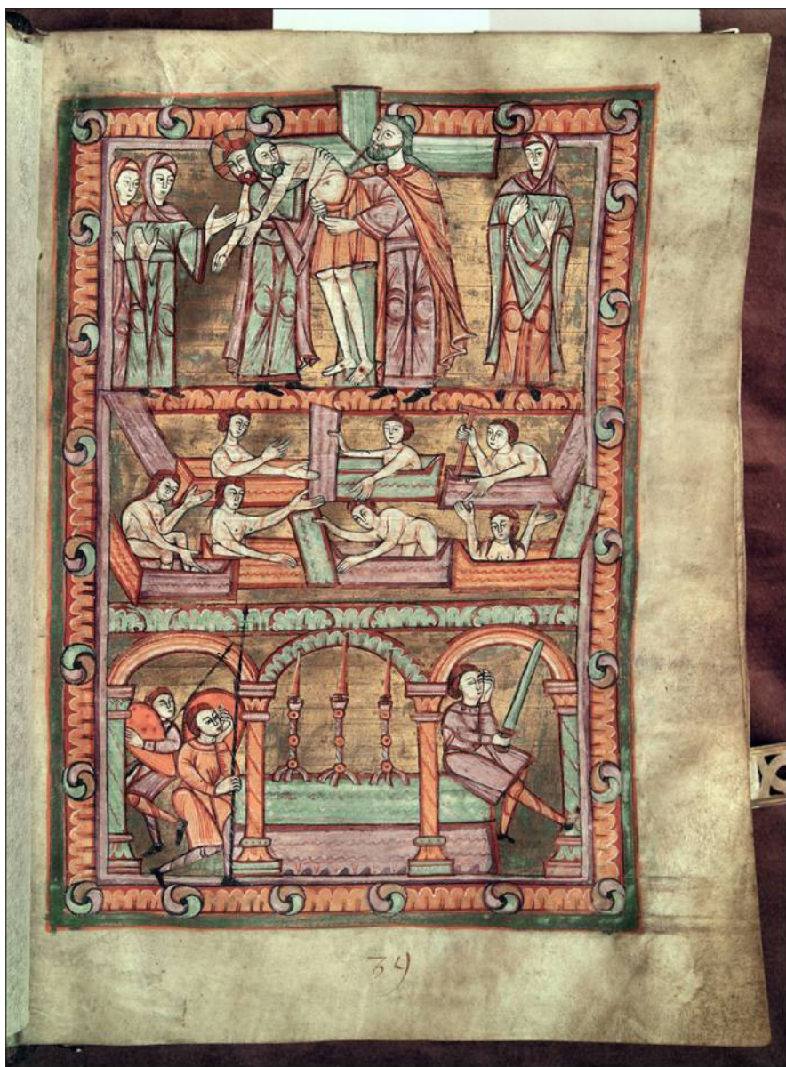
Ilustracja 5a. Jedna z kart Złotego kodeksu – obraz uzyskany w świetle widzialnym (VIS)