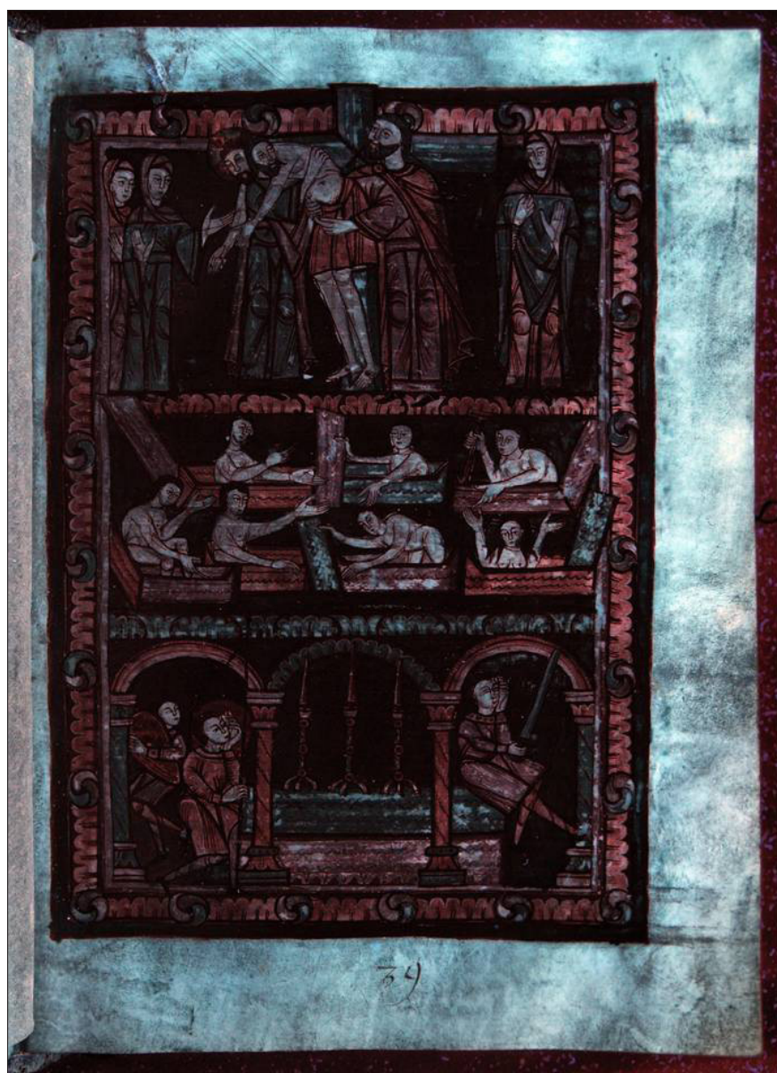
Ilustracja 5c. Jedna z kart Złotego kodeksu – obraz uzyskany w technice fluorescencji wzbudzonej promieniami UV