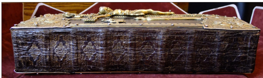
Ilustracja 2. Oprawa Złotego kodeksu od strony grzbietu