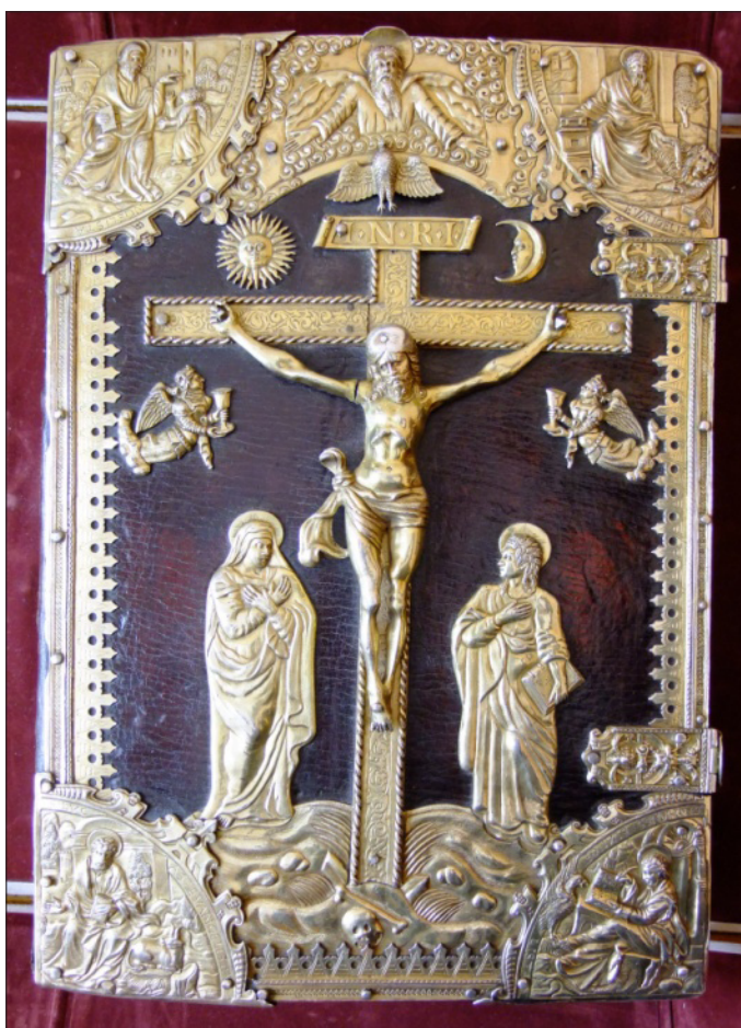
Ilustracja 3. Oprawa Złotego kodeksu – przód oprawy