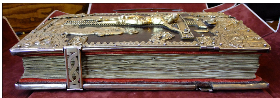
Ilustracja 1. Oprawa Złotego kodeksu od strony krawędzi przedniej bloku

Należy zaznaczyć, że rozwój w ostatnim czasie technik badawczych niezwykle ułatwia konserwatorom dotarcie do „prawdy obiektu”, nie jest jednak jedynym gwarantem pozyskania o nim pełnej wiedzy. Interpretacja otrzymanych wyników w ogromnej mierze zależy bowiem od doświadczenia i wiedzy specjalisty oraz jego otwarcia na współpracę z pozostałymi członkami interdyscyplinarnego zespołu. Dla wyników badań decydujące są również miejsca pobrania próbek. Każda z technik ma ponadto ograniczenia, o czym należy wiedzieć i umieć wykorzystać owo szerokie spektrum technik badawczych dla zdobycia wiedzy o technice, technologii i stanie zachowania badanego artefaktu.