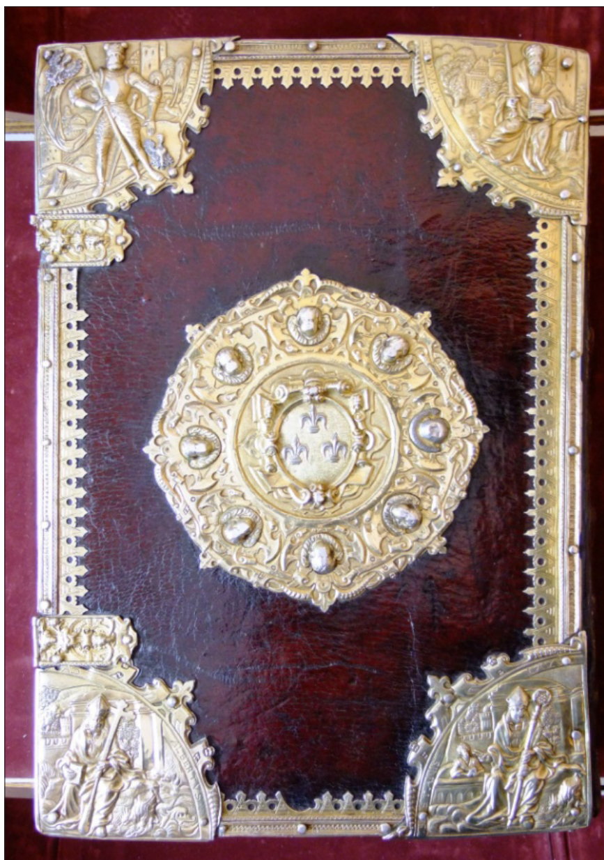
Ilustracja 4. Oprawa Złotego kodeksu – tył oprawy