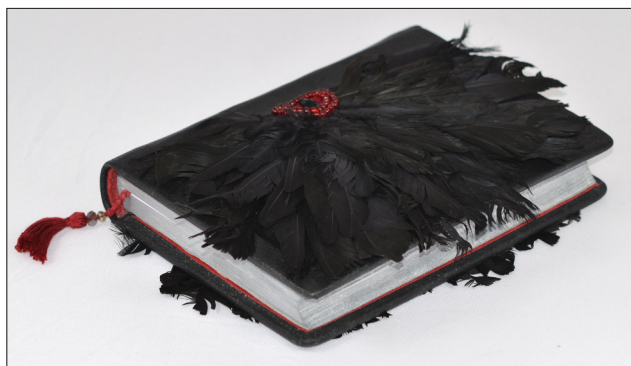
Fot. 7. Oprawa autorstwa Aleksandry Cybul