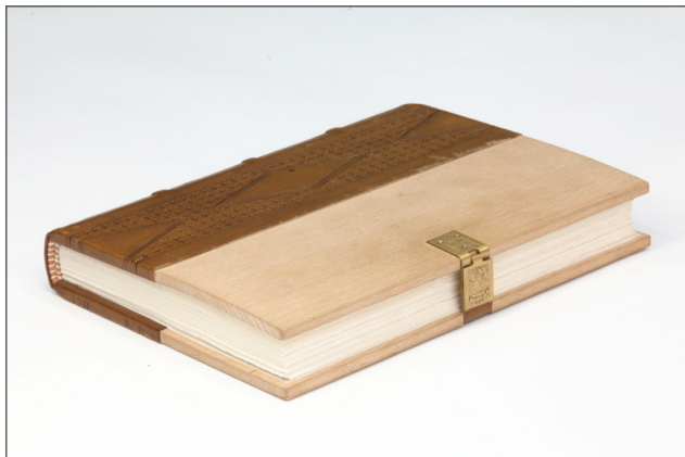
Fot. 1. Oprawa mnisza