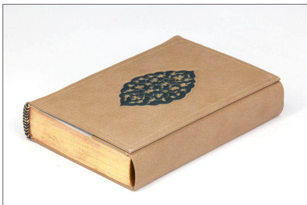
Fot. 3. Oprawa kopertowa