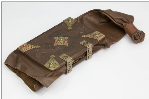
Fot. 2. Oprawa sakwowa