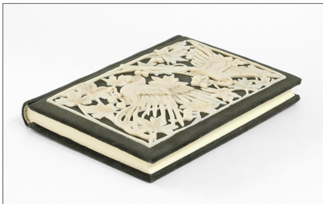
Fot. 6. Oprawa autorstwa Magdaleny Niedźwiadek