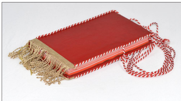
Fot. 9. Oprawa autorstwa Katarzyny Rosik

autorka, „Kolekcja Prêt-à-écrire powstała ze skrzyżowania dwóch przedmiotów codziennego użytku – zeszytu i torby, których forma w znakomitej większości przypadków podlega ściśle zasadom ergonomii człowieka i zrodziły się dlatego tylko, by być użytecznymi. Proces kształtowania się obydwu przedmiotów rozpoczął się tysiące lat temu i wydaje się, że doszliśmy do doskonałości, nie tylko poprzez znalezienie odpowiednich materiałów, formatów, praktycznych rozwiązań, ale również przez różnorodność projektową, dzięki której schlebia się gustom wielu. Wydawać by się mogło, że wszystkie możliwości zostały już wyczerpane, ale obecne czasy nie pozwalają spocząć twórcom. Współczesny użytkownik też jest spragniony nowych kombinacji, dostarczając wiele radości projektantom, którzy mogą wprowadzić swoje koncepcje do produkcji i do wykorzystania w codzienności. Seria torbo-zeszytów wykonanych tradycyjnymi technikami jako proto-