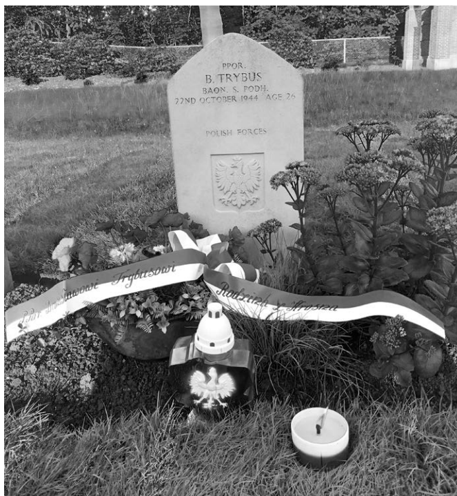
Il. 4. Grób ppor. B. Trybusa na cmentarzu wojennym w Leopoldsburgu (Belgia), sierpień 2023