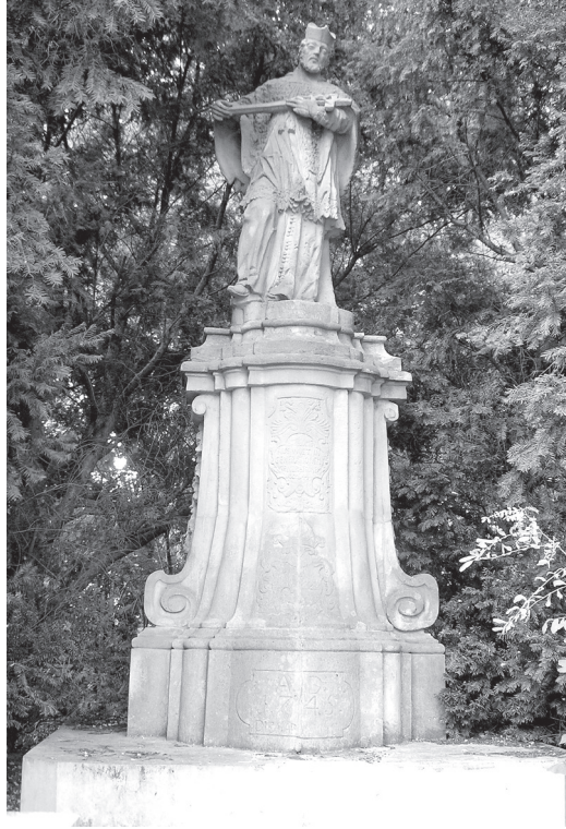
Figura św. Jana Nepomucena w Konarzewie

Przedmiotowy spis został najpierw sporządzony w brudnopisie – każda karta na końcu tekstu podpisana przez Annę Działyńską 75 . Na podstawie tego brudnopisu sporządzono oryginał 76 już bez podpisu osoby spisującej. Spis zawiera rzeczy umieszczone w 17 skrzyniach. W skrzyni pierwszej znajdują się głównie siodła, uprząż końska, broń biała. W skrzyni drugiej, trzeciej, czwartej i siódmej – odzież noszona przez osobę zmarłą. W piątej, szóstej, ósmej i dwunastej – kilimy, kobierce, pawilony, kapelusze. W dziewiątej, dziesiątej i jedenastej – skóry, kotary, przykrycia. W trzynastej sprzęt do odprawiania mszy świętej, w czternastej instrumenty muzyczne i warcaby. W piętnastej armatki i moździerzyki mosiężne. W szesnastej lejce, katery, koce. W siedemnastej – skóry jelenie i odzież dla strzelców pańskich i służby, z elementami srebrnymi.