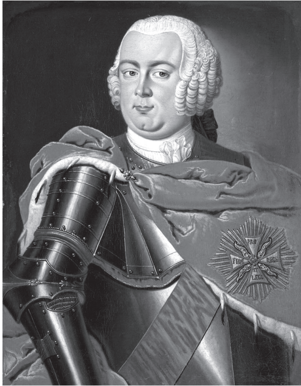
Portret Augusta Działyńskiego – olej na płótnie 25

podkomorzym wschowskim – nominacja 21 maja 1742 roku 23 , a w 1750 roku wojewodą kaliskim – nominacja 29 sierpnia 1750 roku 24 .