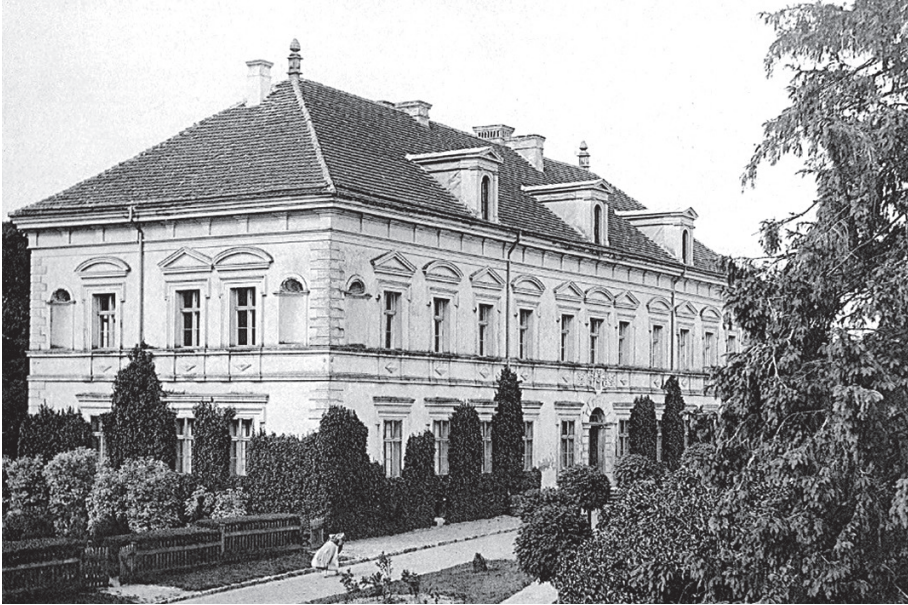
Zdjęcie pałacu z początku XX w.