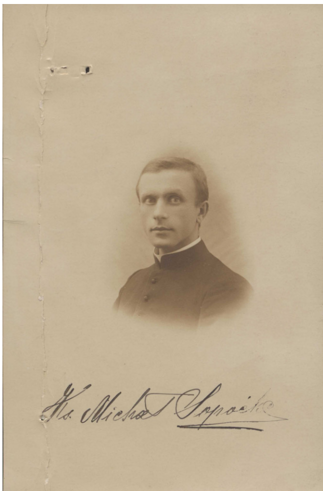
Fot. 1. Ks. Michał Sopoćko jako student Uniwersytetu Warszawskiego w 1918 roku