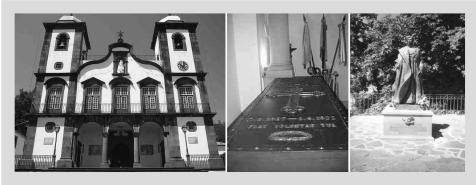
5. Kościół Nossa Senhora, grób i pomnik Karola I w Monte na Maderze, http://cs.wikipedia.org/wiki/Monte_(Funchal) ; http://en.wikipedia.org/wiki/File:Tomb_of_blessed_carl.JPG (dostęp: 15.03.2025)

w sankcji pragmatycznej. Karol IV, tak jak przed dwoma wiekami Maria Teresa, założycielka dynastii habsbursko-lotaryńskiej, szukał w pierwszej kolejności oparcia i pomocy na Węgrzech. Forma realizacji tego zamierzenia w 1921 r. była groteskowa i wyraźnie nieskuteczna 75 . Karolowi nie pomogły towarzystwo i kontrola w drugiej ryzykownej wyprawie na Węgry będącej w drugim miesiącu ciąży żony, która udając się na nią, pozostawiła siedmioro małych dzieci (w wieku od 1. do 9. roku życia) w Szwajcarii. Może nawet byłoby bliższe prawdy stwierdzenie, że w tej drugiej wyprawie cesarz Karol I towarzyszył cesarzowej Zycie.