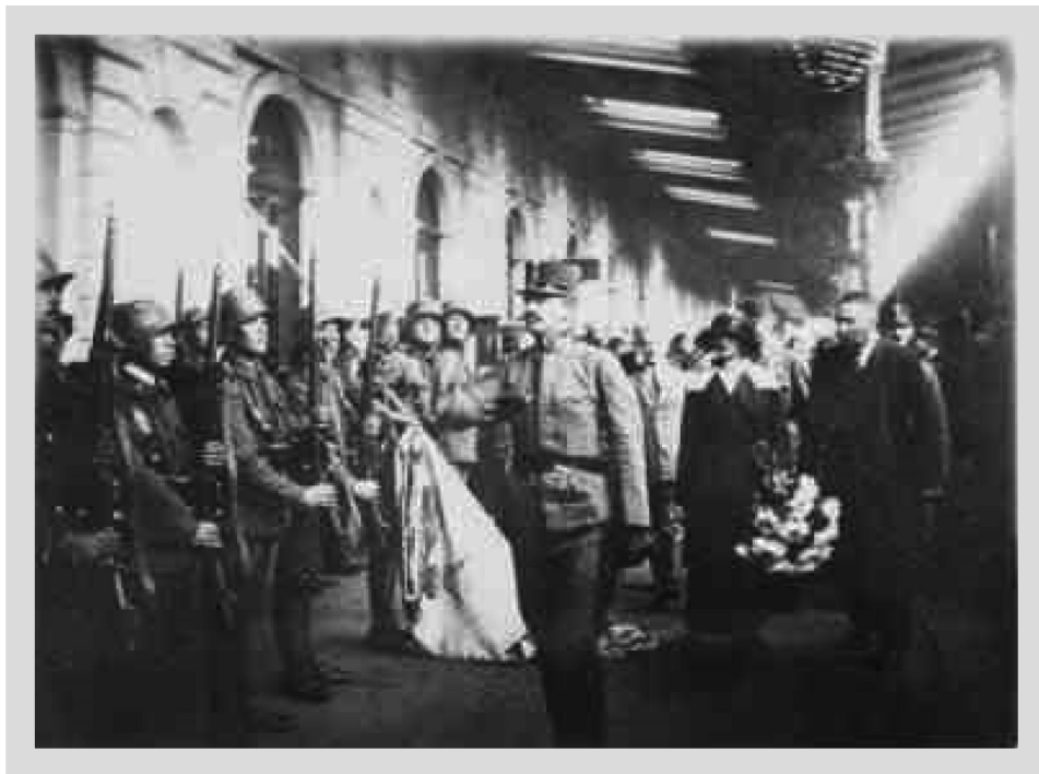
3. Karol IV i królowa Zyta w Sopronie 21 marca 1921 r. przed oddającym im honory oddziałem wojskowym

Poparcie dla Karola IV zgłosiła grupa znanych byłych i aktualnych polityków, wybitnych przedstawicieli węgierskiej arystokracji, snujących plany o przywróceniu dualistycznej monarchii austriacko-węgierskiej, dawnego systemu, jego pozycji ekonomicznej, społecznej i politycznej. Do dyspozycji Karola IV oddał się dowódca okręgu Głównej Królewskiej Armii Węgierskiej. Natychmiast zaprzysiął podległych mu oficerów i żołnierzy jako pierwszy oddział tej armii. Przysięga była składana według tradycyjnej formuły zawierającej zwrot o wierności dla „Karola Habsburga króla Węgier i króla Czech” i tym samym stanowiła prowokację dla niepodległej Republiki Czechosłowackiej.