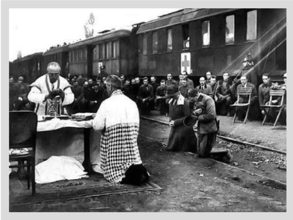
4. Msza św. 23 października 2015 r. podczas uroczystości upamiętniających bitwę pod Budaörs, https://regnum.portal.hu/2023/12/05/aki-nem-kiralysagparti-az-nem-nevezheti-magat-magyar-konzervativnak/ (dostęp: 25.04.2024)

Odbyli nim długą podróż aż do rumuńskiej Galații nad Morzem Czarnym. Tam przeprowadzono ich na krążownik Cardiff, którym przepłynęli na Maderę wyznaczoną na miejsce zesłania 70 .