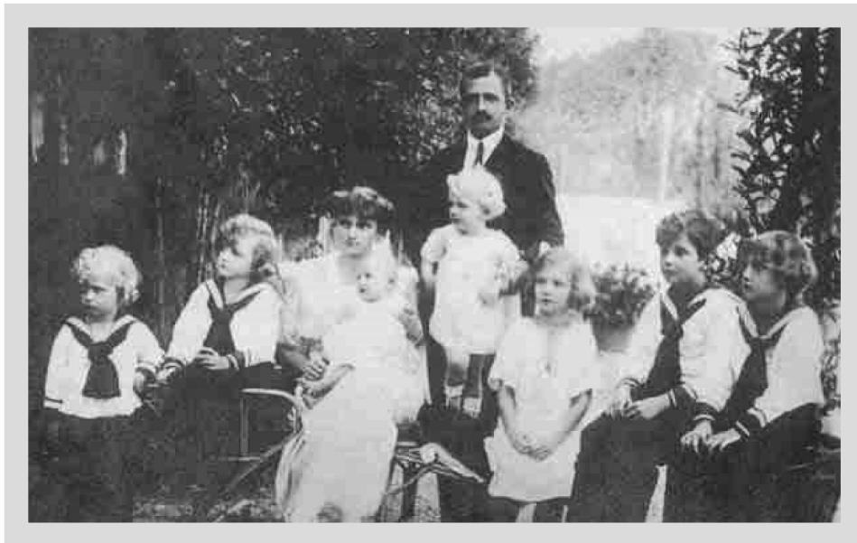
2. Karol i Zyta Habsburg-Lotaryńscy z dziećmi w Szwajcarii w 1921 r.