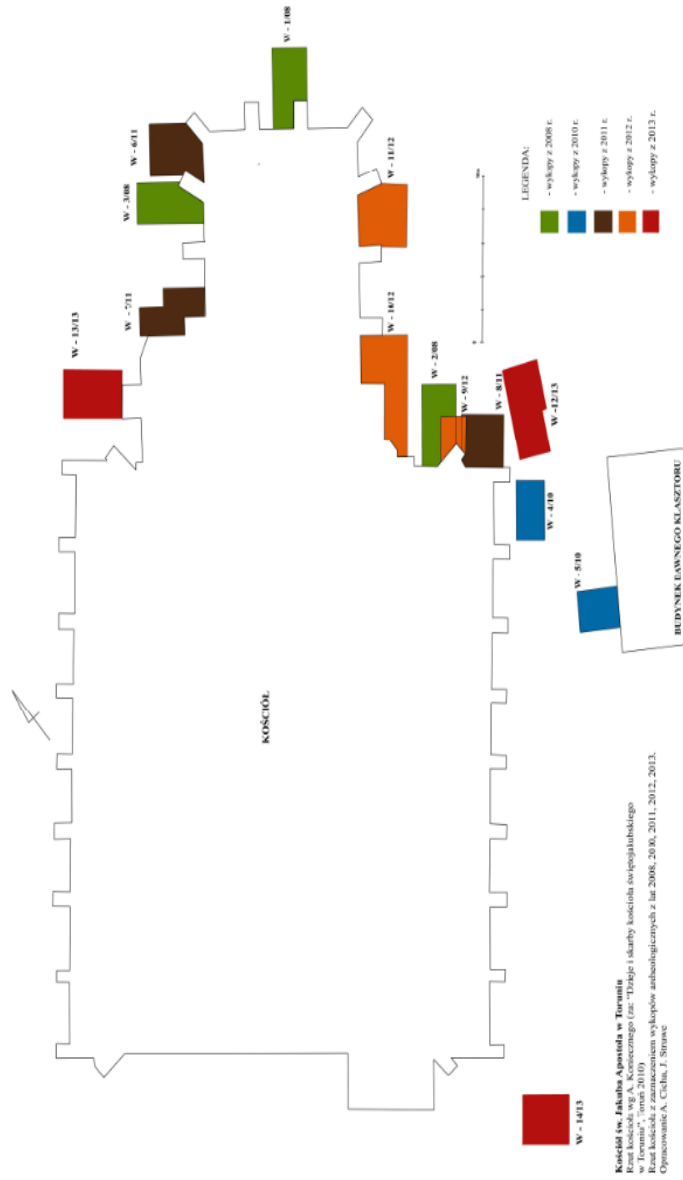
Ryc. 1. Rzut kościoła z zaznaczeniem wykopów archeologicznych z lat 2008–2013 (oprac. A. Cicha, J. Struwe)