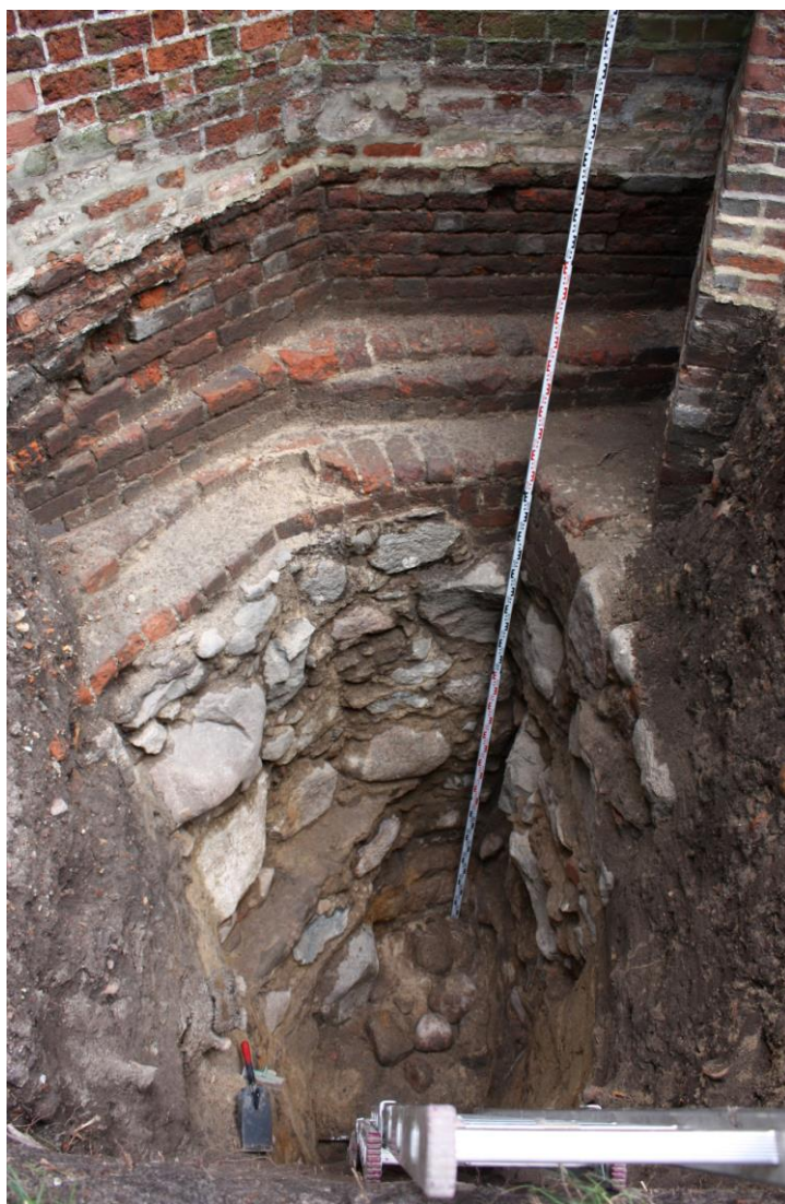
Ryc. 3. Fundamenty północnej strony prezbiterium (wykop W-6/11)