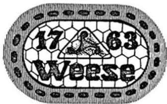
Il. 6. Znak towarowy (nr rej. 15135) zarejestrowany 30 lipca 1927 r., data pierwszeństwa 19 stycznia 1927 r., zgłoszony przez przedsiębiorstwo Gustav Weese