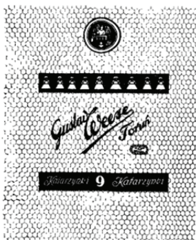
Il. 5. Znak towarowy (nr rej. 13942), zarejestrowany 2 grudnia 1926 r., data pierwszeństwa 7 października 1922 r., zgłoszony przez przedsiębiorstwo Gustav Weese