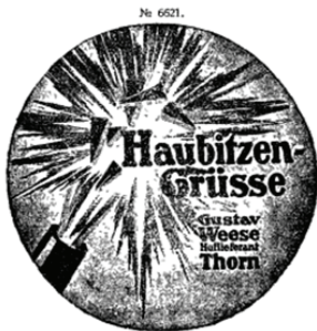
Il. 3. Znak towarowy (nr rej. 6621) zarejestrowany 16 lipca 1925 r., data pierwszeństwa 30 sierpnia 1920 r., zgłoszony przez przedsiębiorstwo Gustav Weese