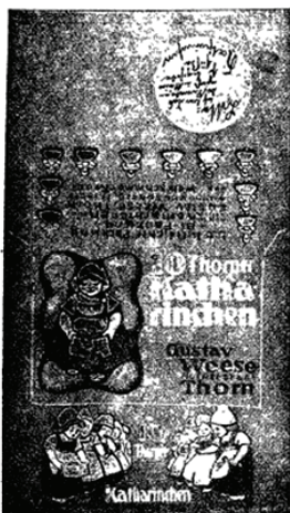
Il. 4. Znak towarowy (nr rej. 6623) zarejestrowany 16 lipca 1925 r., data pierwszeństwa 30 sierpnia 1920 r., zgłoszony przez przedsiębiorstwo Gustav Weese