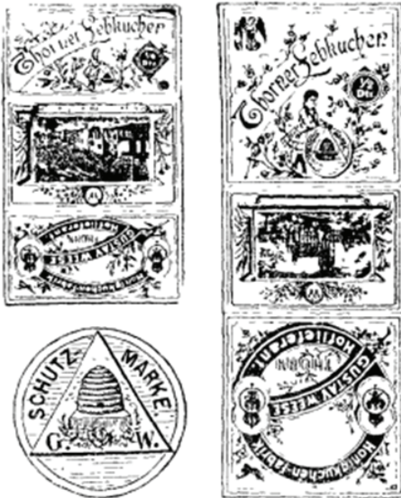
Il. 2. Znak towarowy (nr rej. 6612) zarejestrowany 15 lipca 1925 r., data pierwszeństwa 30 sierpnia 1920 r., zgłoszony przez przedsiębiorstwo Gustav Weese