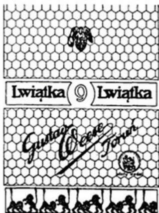
Il. 7. Znak towarowy (nr rej. 15145) zarejestrowany 30 lipca 1927 r., data pierwszeństwa 28 sierpnia 1926 r., zgłoszony przez przedsiębiorstwo Gustav Weese