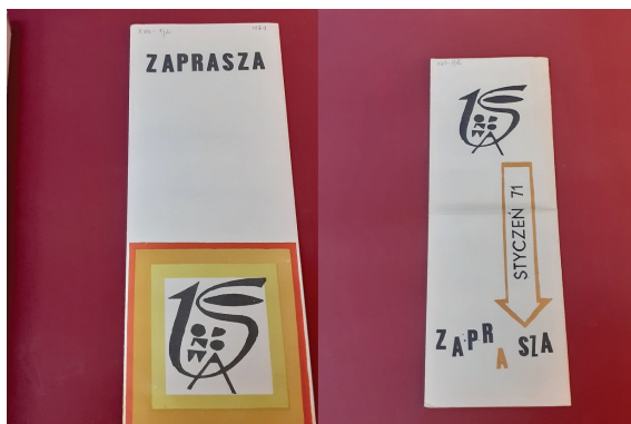
Fot. 4. Programy miesięcznej działalności „Od Nowy” ze znakiem graficznym na styczeń i luty 1971 r.

Nieco później na fasadzie Dworu Artusa, na lewo od wejścia do klubu, zawisł metalowy szyld z kogutem (fot. 5–6).