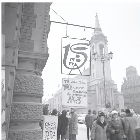
Fot. 5. Szyld „Od Nowy” przed wejściem do klubu w Dworze Artusa z brakującą literą „O” w nazwie klubu (kwiecień 1974), awers

Nieco później na fasadzie Dworu Artusa, na lewo od wejścia do klubu, zawisł metalowy szyld z kogutem (fot. 5–6).