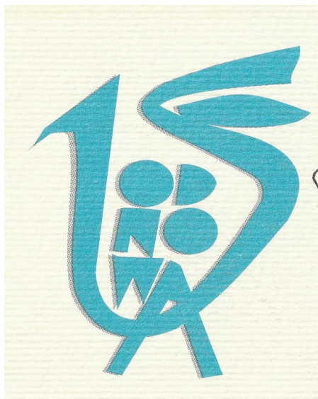
Fot. 3. Znak graficzny „Od Nowy” 1969/1970

Znak graficzny (logo) „Od Nowy” w postaci stylizowanego koguta z wpisaną w ogon nazwą klubu pojawił się po raz pierwszy na zaproszeniach, kartach wstępu i programach klubowych na przełomie lat 60./70. w szczególnym okresie działalności „Od Nowy” związanym z jubileuszem 10-lecia klubu (fot. 3–4).