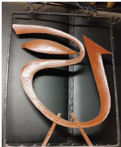
Fot. 12. Szyld „Od Nowy”, stan przed rekonstrukcją

Jednego jest natomiast absolutnie pewien: metalowy szyld, który w roku 1971 zawisł przed wejściem do „Od Nowy”, wykonali studenci w Zakładzie Grafiki Wydziału Sztuk Pięknych na ulicy Moniuszki z deficytowej i trudno dostępnej blachy miedzianej. Jeszcze jako licealista był świadkiem ustaleń w pracowni ojca, które elementy szyldu należy puncować 9 i jak połączyć litery z nazwą klubu (fot. 12). To akurat łatwo sprawdzić, wystarczyło poskrobać poczerniałe pozostałości po szyldzie znajdujące się w magazynie „Od Nowy”.