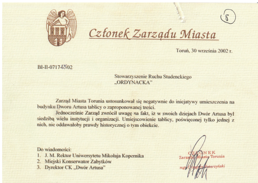
Fot. 2. Decyzja zarządu miasta Torunia odmawiająca udzielenia zgody na umieszczenie tablicy pamiątkowej w wykuszu wejścia do Dworu Artusa