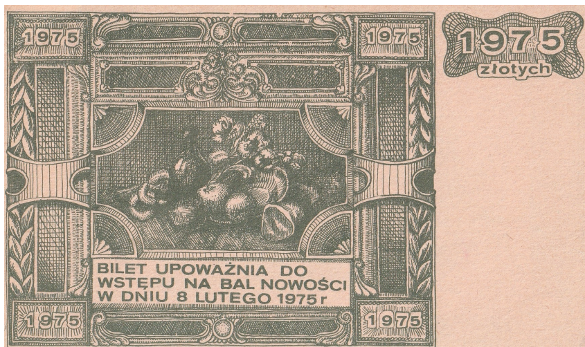
Fot. 10. Maks Szoc, projekt zaproszenia na bal „Nowości” 8 lutego 1975, awers