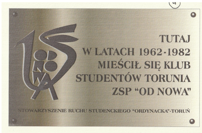
Fot. 1. Tablica pamiątkowa w wykuszu wejścia do Dworu Artusa upamiętniająca działalność klubu „Od Nowa” ufundowana w roku 2002 przez Stowarzyszenie Ruchu Studentckiego „Ordynacka”