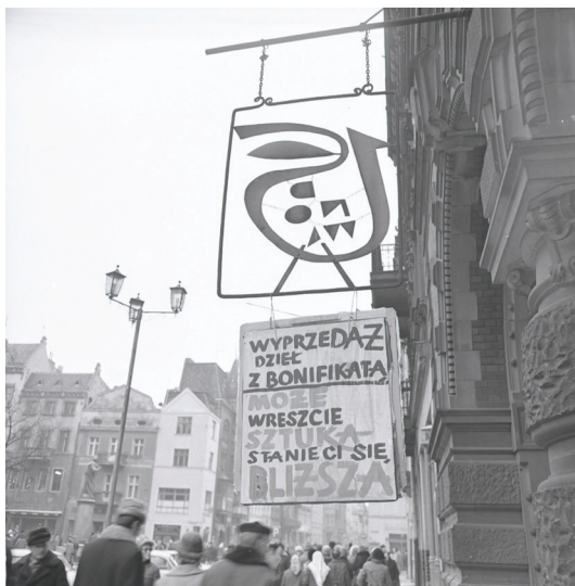
Fot. 6. Szyld „Od Nowy” przed wejściem do klubu w Dworze Artusa z brakującą literą „O” w nazwie klubu (kwiecień 1974), rewers