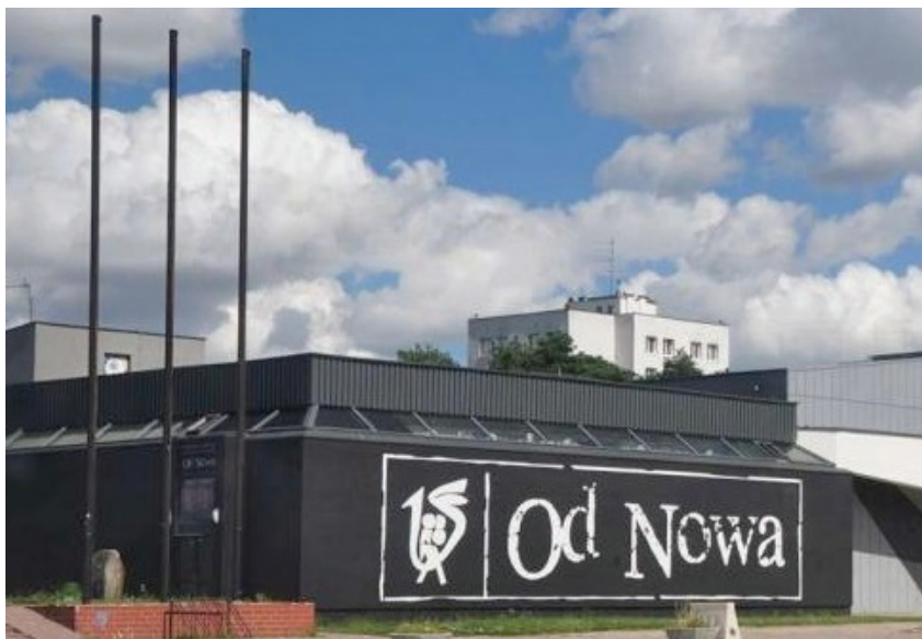
Fot. 9. Logo „Od Nowy” w formie muralu na elewacji budynku klubu, stan obecny, 2023 r.