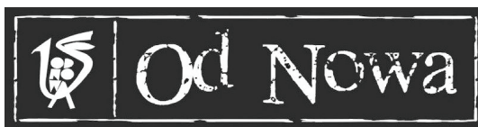
Fot. 8. Logo „Od Nowy” zmodyfikowane w roku 2001 (ze zbiorów Biblioteki Głównej UMK)

Logo „Od Nowy” zostało zmodyfikowane graficznie w roku 2001 (fot. 8) poprzez linearne dodanie nazwy klubu stylistycznie nawiązującej do literackiego znaku graficznego „Jazz Od Nowa Festiwal” – sztandarowej imprezy klubu zainaugurowanej wiosną 2001 r. Logo przetrwało ponad 50 lat i zdobi dzisiaj w postaci muralu fasadę nowej, rozbudowanej, siedziby klubu na Bielanach (fot. 9).