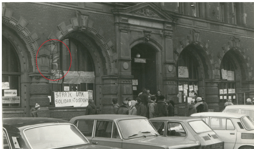
Fot. 7. Szyld „Od Nowy” przed wejściem do Dworu Artusa w czasie solidarnościowego strajku studentów UMK na przełomie listopada i grudnia 1981. W ogniu brakuje wszystkich liter nazwy