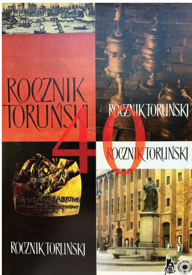
Fot. 2. Obwoluta „Rocznika Toruńskiego” 40 (2013)

Nie sposób omówić wszystkie artykuły i materiały, które przez te lata pojawiły się na łamach „Rocznika Toruńskiego”. Pewne jest natomiast, że wszystkie są niezwykle cenne i ciekawe, a co najważniejsze opisują i przybliżają życie i przeszłość naszego miasta.