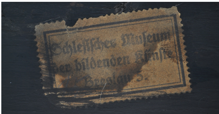
Il. 4. Nalepka z obramienia skrzydła ołtarzowego, Muzeum Okręgowe w Toruniu, nr inw. MT/M/373/SN (fot. W. Binnebesel, 2020)

wykluczającym to, jest fakt odnotowania w protokole zdawczo-odbiorczym z 24 września 1951 r. numeru inwentarzowego, naniesionego przez składnicę – 3577. Trudno ustalić jej pochodzenie. Mogła ona zostać naniesiona jako element ewidencji prowadzonej przez niemieckich opiekunów składnic lub jest świadectwem, że rzeźba Marii z Dzieciątkiem była wcześniej elementem kolekcji muzealnej bądź prywatnej (sądząc po wysokości numeru – 457 – całkiem sporej). Podobne „znaczkowe” nalepki wykorzystywane były m.in. przez Śląskie Muzeum Sztuk Pięknych, jednak miały one inne rozmiary, a nalepki własnościowe miały podaną nazwę instytucji (np. obraz ze zbiorów Muzeum Narodowego we Wrocławiu o nr. inw. MNWr VIII-2992, czy też jedno ze skrzydeł ołtarzowych z toruńskiego muzeum o nr. inw. MT/M/374/SM (il. 4). Nie da się wykluczyć jednak możliwości, zdaje się najbardziej prawdopodobnej, że nalepka ta została naniesiona w wyniku doraźnej potrzeby, np. na czas transportu. Nalepki „znaczkowe”, jak się wydaje, były stosowane zarówno przed wojną, jak i po jej zakończeniu dość powszechnie.