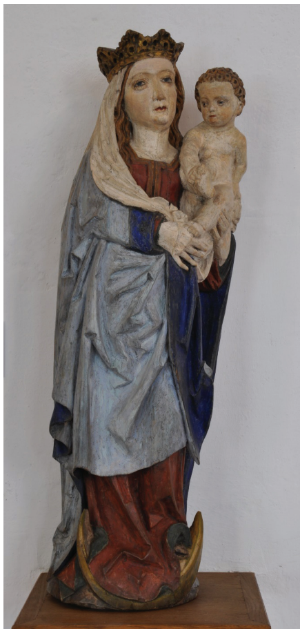
Il. 7. Madonna z Dzieciątkiem, Muzeum Okręgowe w Toruniu, nr inw. MT/Rz/12/SN