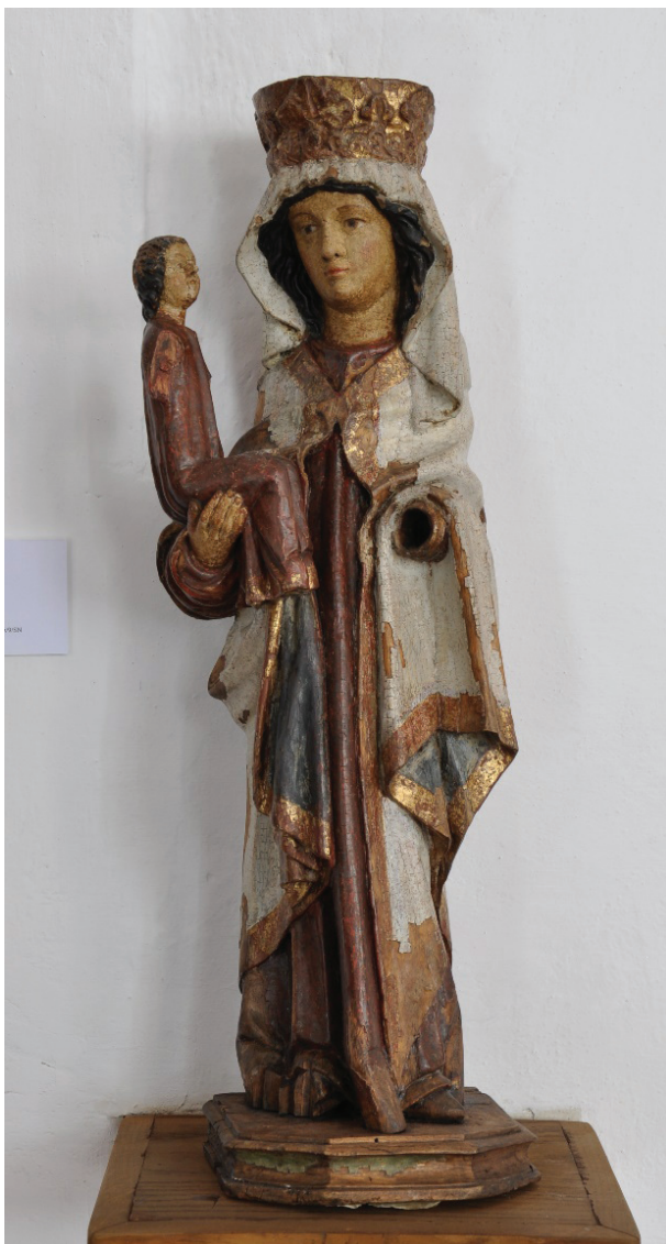
Il. 5. Madonna z Dzieciątkiem, Muzeum Okręgowe w Toruniu, nr inw. MT/Rz/9/SN