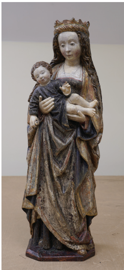
Il.1. Madonna z Dzieciątkiem