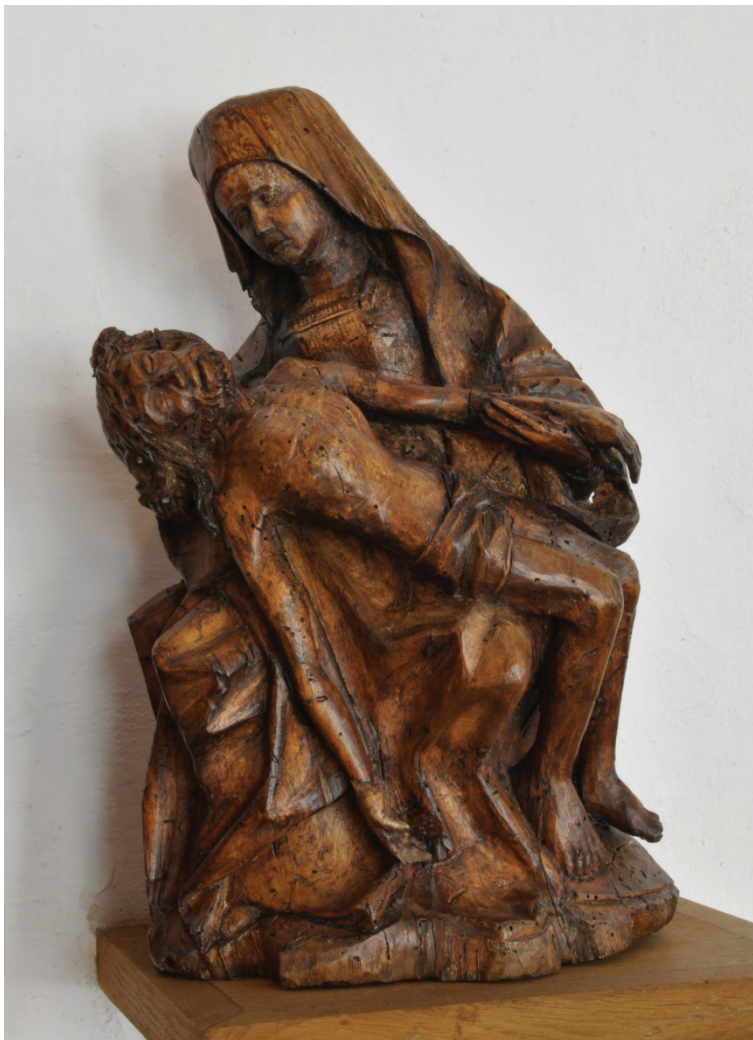
Il. 8. Pieta, Muzeum Okręgowe w Toruniu, nr inw. MT/Rz/10/SN