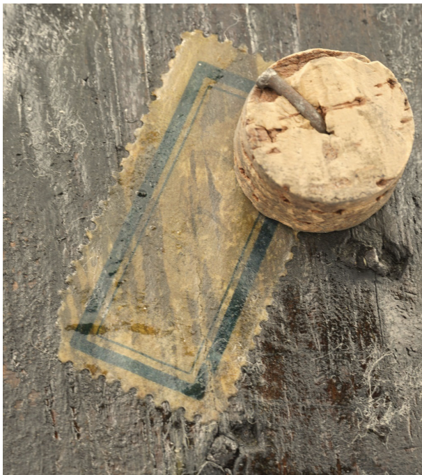
Il. 2. Nalepka z odwrocia rzeźby

spodzie cokolika rzeźby Madonny z Dzieciątkiem ze zbiorów toruńskich (MT/Rz/9/SN). Na prostokątnej kartce, czerwonym ołówkiem jest naniesiony napis „Narożno / 965” (il. 3). Sądząc po wysokości numeru inwentarzowego, obiekt ten bardzo szybko znalazł się w składnicy. Podobne „odręczne” nalepki można znaleźć m.in. na czterech nowożytnych obrazach Sybill z Muzeum Narodowego w Warszawie (nr inw. M.OB. 1830, 1831, 1832 i 1919) 60 . Co ciekawe, na nich również widnieje niski, wspólny dla tych czterech obrazów numer 994. Wskazywać to może, że w początkowym okresie funkcjonowania składnicy posługiwano się nalepkami bez pieczętek. Przykładem innego rodzaju nalepki może być znajdująca się na odwrociu obrazu ze zbiorów Muzeum