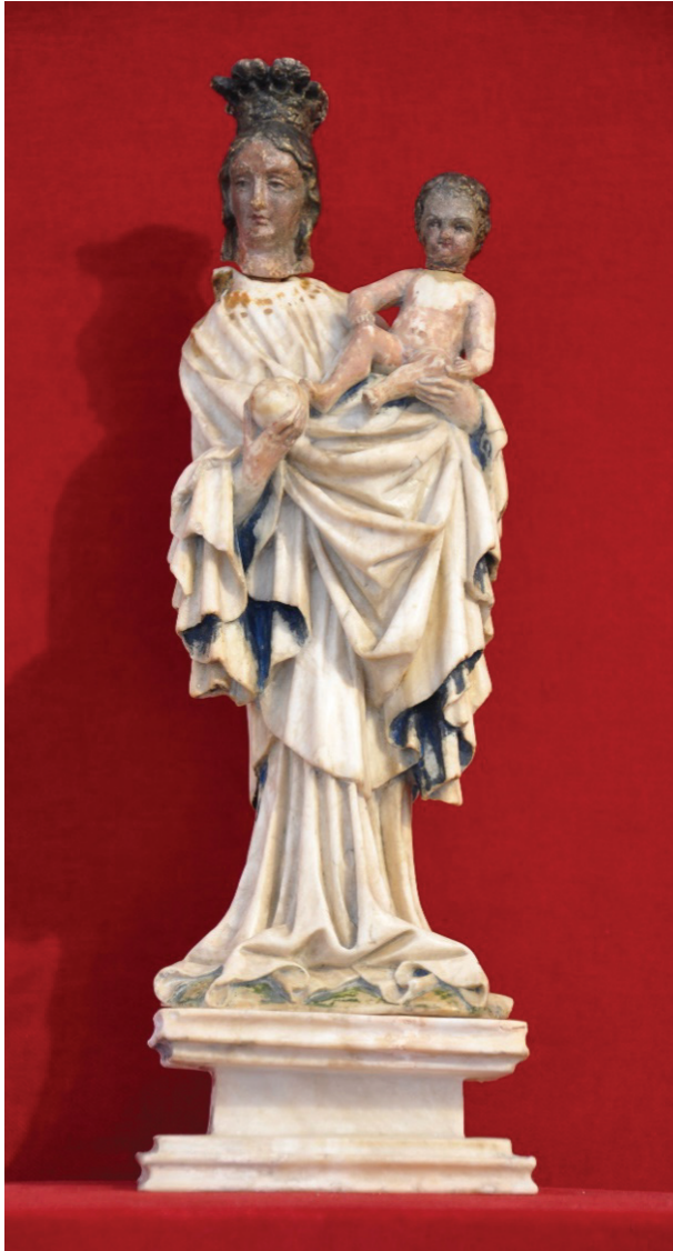
Il. 6. Madonna z Dzieciątkiem, Muzeum Okręgowe w Toruniu, nr inw. MT/Rz/12/SN