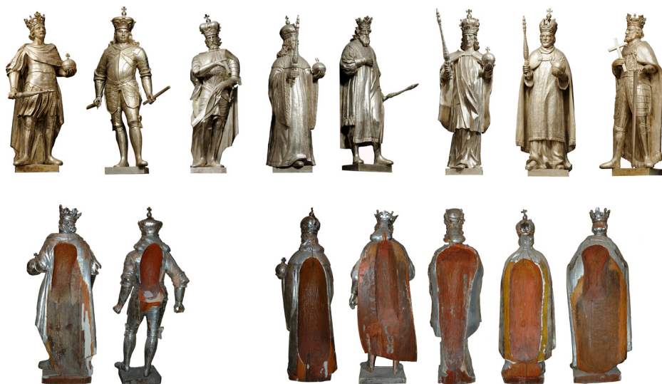
Il. 4. Kaplica św. Kazimierza, zestawienie figur A-H; fot. i oprac. P. Jamski, 2005 i 2011 r.