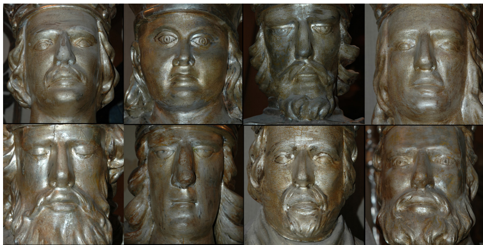
Il. 6. Kaplica św. Kazimierza, detale figur A–H; fot. P. Jamski, 2005 r.

były przygotowane do oglądania od tyłu. Nie wykańczano partii włosów, a przewidywany przez projektanta brak oglądów bocznych nie skłonił ich twórców do zastosowania choćby minimalnych korektur optycznych. Niemal pominięta jest dekoracja ubioru, co najbardziej widoczne jest w niezwykle ogólnym sposobie oddania obuwia. Szczegóły fizjonomii są również dalece schematyczne. Dotyczy to ukazania dłoni, mimiki twarzy, także opracowanie oczu i włosów. Do wskazania nieskoordynowanego lub wtórnego działania skłania sposób ich umocowania na postumentach, stopy wystają bowiem poza obręb podstawy.