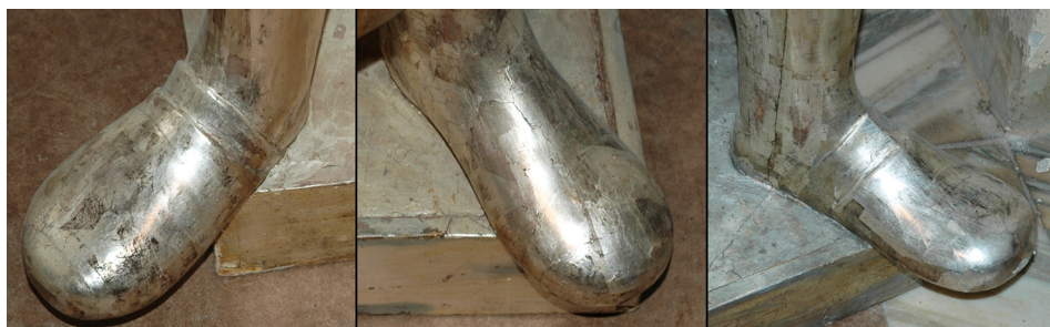
Il. 8. Kaplica św. Kazimierza, detale figur H, E, B; fot. P. Jamski, 2005 r.

Postawa ciał, układ kończyn, skręt głów nie harmonizuje z marmurowymi niszami, nie zgadza się też z rozmieszczeniem ich w konkretnych narożach kaplicy, figury nie nawiązują z potencjalnym, stojącym na poziomie posadzki widzem „kontaktem” wzrokowego. Jedynie figura C jest dopasowana do wysokości, na której ma być ustawiona, poprzez pochylenie głowy stara się jakby „wypatrzeć” wiernych stojących około 2,5 m niżej. Wydaje się, że pierwotnym przeznaczeniem ośmiu figur nie była kaplica św. Kazimierza. Fakt pierwszego ich odnotowania dopiero na początku drugiej trzecji XVIII w. oraz nieco zdawkowe formy stylistyczne skłaniają do zaproponowania ich związku z niezwykle uroczystymi egzekwiami po śmierci Augusta II Mocnego w 1733 r. Między śmiercią króla 1 lutego a odprawionymi 32 dni później (3 marca) wileńskimi egzekwiami nie było wystarczająco dużo czasu, by przygotować wszystkie detale dużej konstrukcji castrum doloris z rozmachem i równocześnie na wysokim poziomie artystycznym. W tym okresie ich promotor i organizator – biskup Michał Jan Zienkowicz – musiał przyjechać z Warszawy do Wilna, by w ciągu kilku tygodni zrealizować ambitny plan uroczystości 40 .