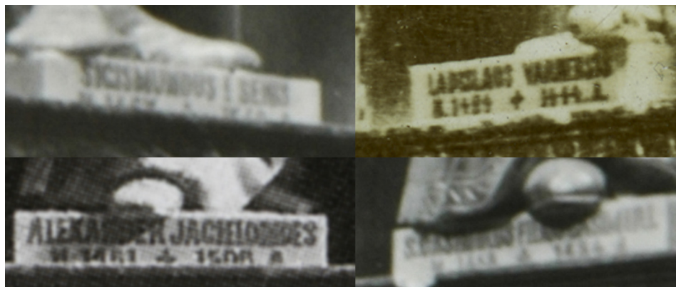
Il. 2. Kaplica św. Kazimierza, fragmenty napisów na postumentach figur C, B, F, D; fot. J. Bułhak, 1937 r.

1878 26 (wówczas napisy poprawiono złotą farbą) i 1934 27 . Kolejnych restauracji dokonano po przejęciu rzeźb przez Lietuvos nacionalinis dailės muziejus w 1952 28 , a następnie w 1989 r., kiedy to konserwatorzy dokonali uzupełnienia braków w figurach, m.in. wykonano berło dla figury H. Wówczas zlikwidowano również polskojęzyczne napisy na postumentach, ponieważ „nie wyglądały na bardzo stare”. Zachowano kilka przyklejonych na odwrocie figur niewielkich papierowych kart, rodzaj pisma na nich występującego wskazuje na ich powstanie nie wcześniej niż w drugiej połowie XIX w. 29 Ostatnie prace konserwatorskie miały miejsce w 2004 r. 30