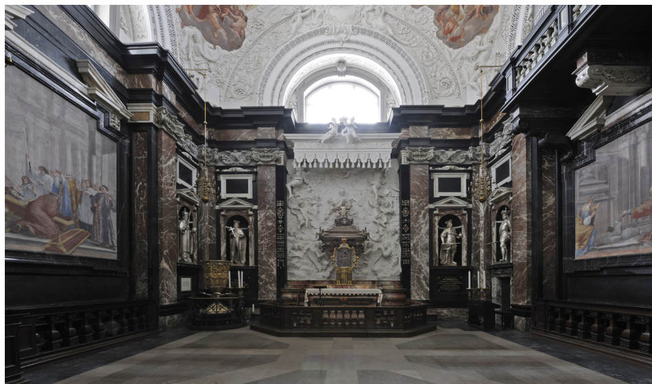
Il. 1a. Kaplica św. Kazimierza, widok na ścianę ołtarzową, widoczne figury G, H, A, B