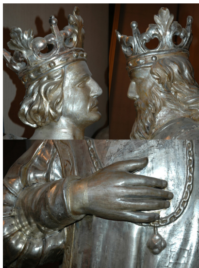
Il. 5. Kaplica św. Kazimierza, detale figur A, E, F; fot. P. Jamski, 2005 r.