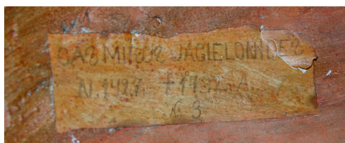
Il. 3. Kaplica św. Kazimierza, karteczki naklejone na odwrociu figur F, A, G; fot. P. Jamski, 2005 r.