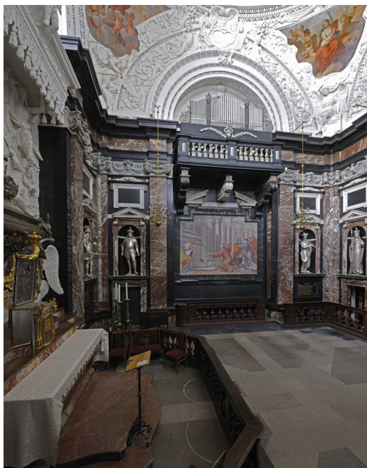
Il. 1b. Kaplica św. Kazimierza, widok na ścianę ołtarzową, widoczne figury A, B, C, D; fot. P. Jamski, 2011 r.

już zaśniedziałe najczystrzym srebrem malarskim odświeżono 15 . Równocześnie za pewne uznał istnienie srebrnych posągów od czasów panowania Wazów i takie stanowisko obowiązywało w środowisku naukowym do końca XX w. Powtórzył swoją opinię w kolejnej pracy dotyczącej kościoła katedralnego z 1840 r.: „W niszach posągi króli i cesarzy spowinowaconych z Jagiellonami drewnie blachą srebrną pokrytych 16 . W 1856 r. sceptycznie odniósł się do takiej propozycji identyfikacji posągów Adam Honory Kirkor, zaznaczając równocześnie, że podczas restauracji z lat 1836–1839 figury nie miały jeszcze podpisów 17 . Tenże autor w dużo późniejszej publikacji wskazał jednak konkretne osoby mające być wyrażone w owych posągach, wprost powołując się na ustalenia Homolickiego. „W niszach między pilastrami są przodki, jak mniemają krewnych św. Kazimierza” i dostrzegać można „w tych figurach podobieństwa do Zygmunta Starego, Warneńczyka, św. Kazimierza i innych z rodziny Jagiellońskiej 18 . Koncepcję