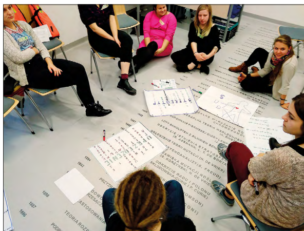
Fot. 2 Uczestniczki i uczestnicy szkolenia dla edukatorów. Projekt „Kto pyta, nie błądzi. Porozmawiajmy o uchodźcach”, Poznań (13.10.2017)