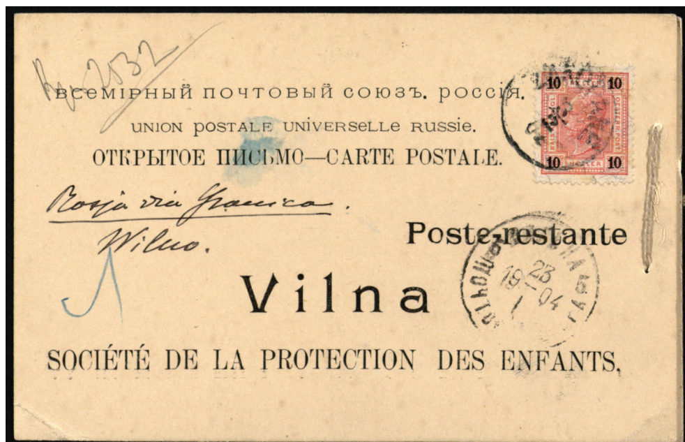
Awers karty korespondencyjnej z drugim aforyzmem Witkiewicza.

Sentencje skierowane do tego samego, zbiorowego adresata (Wileńskiego Towarzystwa Opieki nad Dziećmi) 3 , z identyczną datą wysyłki na stemplu pocztowym (23 I 1904), tworzą myślową całość. Pierwszy z fragmentów stanowi jakby credo człowieka, który przez całe życie służył sprawie jedności narodowej, drugi – jest tego wyznania uszczegółowieniem, przywołującym symboliczne pejzaże dawnej Rzeczypospolitej 4 . Oba zawierają swego ro-