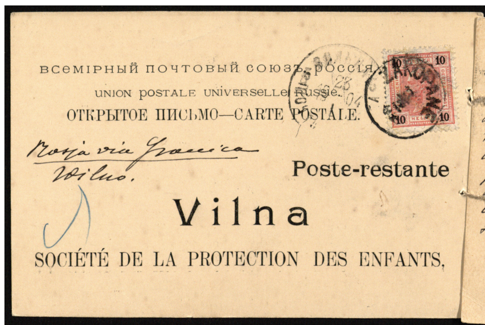
Awers karty korespondencyjnej z pierwszym aforyzmem Witkiewicza.

Karty korespondencyjne w opisie inwentarzowym funkcjonujące jako Dwa aforyzmy – autografy Stanisława Witkiewicza zostały odnalezione w Wilnie w ramach kwerendy przeprowadzonej w Bibliotece Litewskiej Akademii Nauk im. Wróblewskich 1 . Prezentowanych materiałów nie uwzględniają poświęcone Witkiewiczowi zestawienia bibliograficzne (Korniłowicz et al. 1927; Kulczycka-Saloni et al. 1971: 73–79; Szweykowski et al. 1982: 195–208; Loth et al. 2004: 74–76). Nie odnotowuje ich także katalog elektroniczny Biblioteki, odsyłający do kilku innych Witkiewiczowskich rękopisów 2 . Przynależność kart do zasobów bibliecznych dokumentuje zaledwie jeden z katalogów kartkowych dostępnych w Czytelnii Rękopisów. Dodatkową trudność w zidentyfikowaniu korespondencji stanowi podwójna, przyporządkowująca do różnie oznaczonego zespołu archiwalnego, sygnatura (BF-2532, F9-2532).