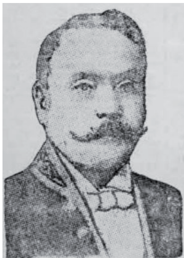
Fukuda Naohiko – wicekonsul Japonii ( Московские вестни , „Русскоеслово” 1909, № 59 (13 марта [28 февраля]), s. 3, [za:] C. C. Павленко, op. cit., s. 262)

mógł jednak dostrzec jeszcze jednej, kto wie, czy nie mniej istotnej płaszczyzny estetycznej (intertekstualnej?), która mogła mieć wpływ na utwory Remigiusza Kwiatkowskiego, mianowicie obecnego w niej dalekiego echa średniowiecznej japońskiej, buddyjskiej idei mujō (niestałość, nietrwałość) 27 .