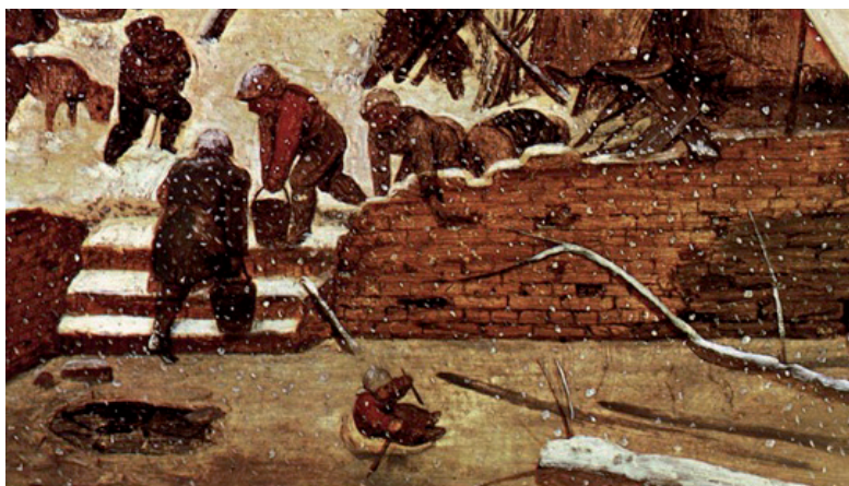
Ryc. 1. Pieter Bruegel. Wielka kolekcja sławnych malarzy . Tom 5, Poznań 2006. (wydanie albumowe bez numeracji stron).

mentowych. Stąd też rzadziej odnajdywane są one podczas badań archeologicznych i spotykane na przedstawieniach ikonograficznych (ryc. 1).