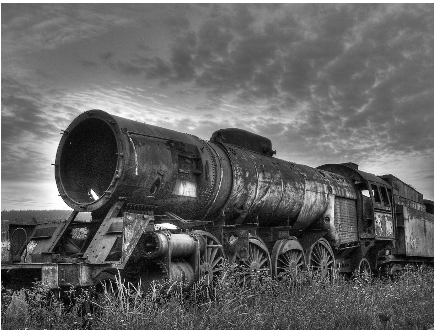
Cmentarzisko lokomotyw, Ścinawka Średnia, pow. kłodzki, fot. Nameless, 2006 r.