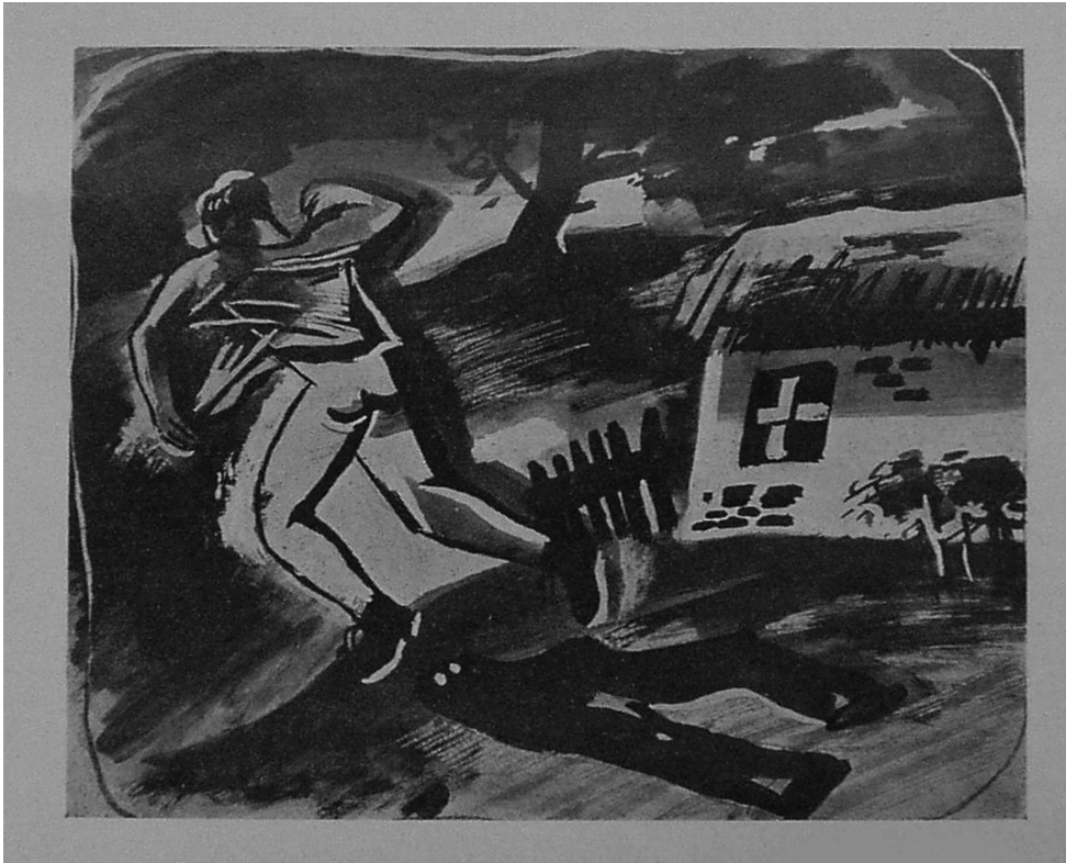
Ilustracja do noweli Lepianka w czystym polu, „Pion” 1933, nr 13 (30 XII), rys. Antoni Kudła

ścianie wizerunek kraty, za którą może być ukryta piękna nieznajoma, ma nieodpartą chęć wdrzeć się do środka i skraść pocałunek pięknej mniszce. Jej prowokacja staje się przyczyną zgonu Śnieżki, bohater wpada bowiem w misternie zastawioną pułapkę – ginie w oknie ze swojej wizji, próbując się dostać do środka tajemnego pomieszczenia. Prowadzi go także do moralnej zguby, pogwałcenia Boskich praw.