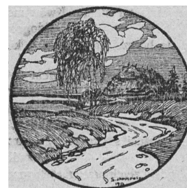
Ilustracja do dramatu Ciemne sity (Willa nad morzem) , Przemysł 1921, rys. S. Jankowski