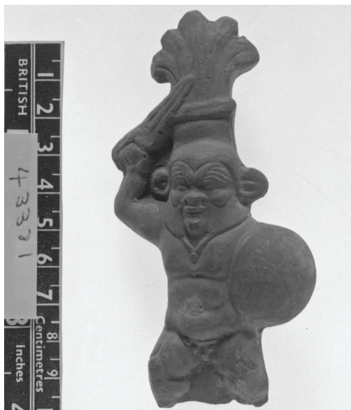
Ryc. 2. Terakotowa statuetka wyobrażająca boga Besa w charakterystycznej koronie uformowanej z piór, w konwencji wojownika, z okrągłą w zarysie tarczą i mieczem. Zabytek datowany jest na okres grecko-rzymski.

bóstwa 6 , zostały – podobnie jak opiekuńczy Bes wyobrażone w konwencji wojownika, co również jest znaczące. Fakt taki, w kontekście interesującego nas tutaj bóstwa, identyfikować należy między innymi z przypisywanymi Besowi funkcjami apotropaicznymi, jego znaczeniem symbolicznym identyfikowanym z szeroko rozumianą walką oraz zwycięstwem.