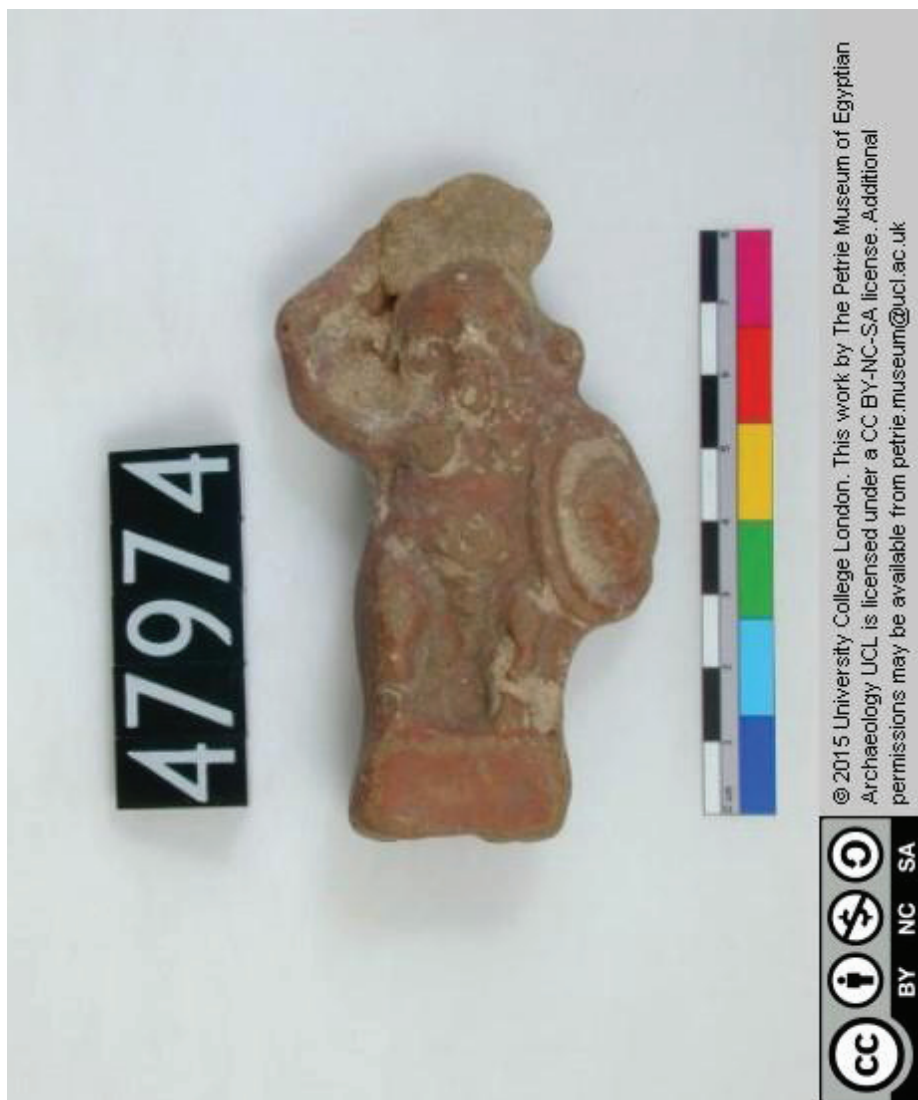
Ryc. 6. Terakotowa statuetka wyobrażająca boga Besa jako wojownika, z mieczem i okrągłą w zarysie tarczą. Zabytek pochodzący z Memfis, datowany jest na okres hellenistyczny. Courtesy of the Petrie Museum of Egyptian Archaeology, UCL (UC47974)