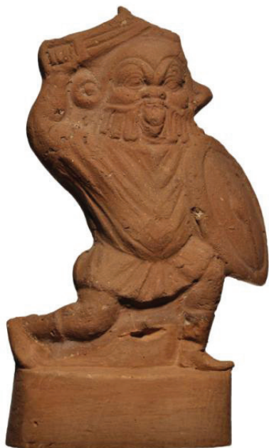
Ryc. 5. Terakotowa statuetka pochodząca z Egiptu (odnaleziona w Naukratis) wyobrażającą biegnącego Besa, w konwencji wojownika, m.in. z mieczem i charakterystyczną tarczą typu thyreos . Zabytek datowany został na II-I wiek przed Chr.

Ikonografia Besa militarne należy do intrygujących zjawisk ikonograficznych z licznych powodów. Jednym z nich jest fakt, że część wizerunków bóstwa w konwencji wojownika wykazuje cechy i tendencje plastyczne zmierzające do archaizacji jego obrazu, szczególnie nawiązując do przedstawień bóstwa uformowanych w okresie Nowego Państwa. Z kolei inne, szczególnie zabytki terakotowe wyobrażające Besa jako wojownika, wykazują tendencje hellenizacji wizerunku bóstwa, odwołując się przy tym do dziedzictwa greckiej sztuki koroplastów. Te dwa główne kierunki rozwoju ikonografii bóstwa nie wydają się bez znaczenia. Jak należy sądzić, powiązane są z funkcjami apotrapiicznymi Besa i jego znaczeniem w religii prywatnej i indywidualnej pobożności, określonych grup etnicznych składających się na społeczeństwo Egiptu okresu grecko-rzymskiego. Bóstwo to w zależności od ikonograficznej formuły, mogło być czczone zarówno