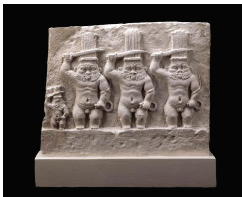
Ryc.1. Wapienna stela wyobrażająca wizerunki boga Besa, Egipt I w. przed Chr–I w. po Chr.

w kontekście egipskiej sztuki koroplastów okresu grecko-rzymskiego ogólnie, jak również w aspekcie innych ikonograficznie wizerunków boga Besa, szeroko rozpowszechnionych i spopularyzowanych w terakotowym rzemiośle egipskim omawianego przedziału chronologicznego. Należy ponadto dodać, że interesujący nas tutaj obraz bóstwa, obecny jest w wyrobach rzemieślniczych, czy artystycznych wykonywanych w innych artystycznych materiałach, takich jak brąz, kamień, czy drewno 5 , co być może wypływa z popularyzacji wizerunku bóstwa w sztuce terakoty.