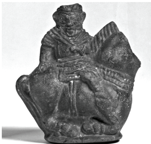
Ryc. 4. Terakotowa butelka stylizowana na wyobrażenie Besa ukazanego w konwencji jeźdźca. Zabytek odnaleziony w Fajum, datowany jest na II wiek przed Chr.

informuje nas szereg źródeł, zarówno archeologicznych, jak i o charakterze historycznym. To właśnie obecność celtyckich wojowników w siłach militarnych Lagidów zainspirowała koroplastów do zastosowania charakterystycznego dla tej grupy wojowników uzbrojenia w postaci dużej owalnej tarczy. Współwystępowanie tego elementu ikonograficznego w obrazie boga Besa ma, jak należy sądzić, szerokie znaczenie symboliczne i magiczne, ale również odnosi się do wydarzeń politycznych 20 . Bez wątpienia bowiem sztuka koroplastów, a przynajmniej niektóre z poruszanych przez nią tematów, identyfikowane być mogą z polityką propagandową Ptolemeuszy.