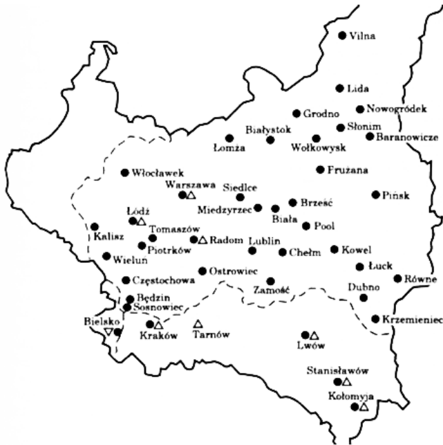
Mapa 1. Ośrodki prasy żydowskiej w Polsce 1918–1939

Prasa żydowska w językach: ● jidysz i hebrajskim; ▲ polskim; ▼ niemieckim