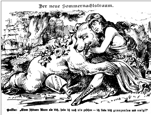
Ilustracja nr 7

lata później – niedźwiedzia ściskającego pólnagą, czule obejmującą go Mariannę i równocześnie śliniącego się do butelki wódki 38 .