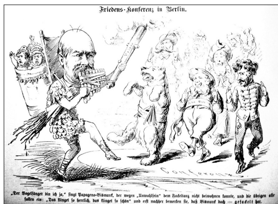
Ilustracja nr 4

Tendencję tę dobrze widać na przykładzie ewolucji, jakim podlegał obraz „rosyjskiego niedźwiedzia” jako uczestnika wspomnianych wydarzeń. Rysunek z 1878 r. przedstawia go jako potulne zwierzę, tańczące w takt muzyki Bismarcka-ptasznika wraz z innymi członkami konferencji berlińskiej 29 .