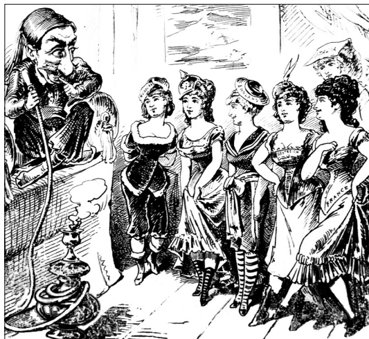
Ilustracja nr 14

[F. Boscovits, Europäische Frühjahrsmoden , „Nebelspalter“ 1900, nr 14 (fragment), udostępnione przez Kantonsbibliothek Vadiana St. Gallen]