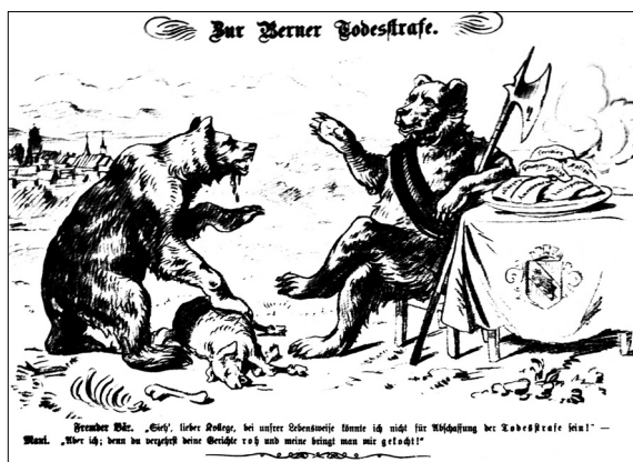
Ilustracja nr 11

[b.a., Wer isst die Suppe aus? , „Nebelspalter” 1881, nr 13]