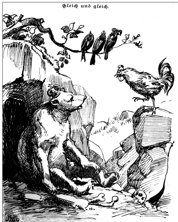
Ilustracja nr 6

dalności związku europejskiej republiki z despotyczną monarchią, wzniosłej Marianny z polarnym niedźwiedziem. Prym wiodła tu prasa niemiecka, prasa szwajcarska dorównywała jej jednak pod względem złośliwości.