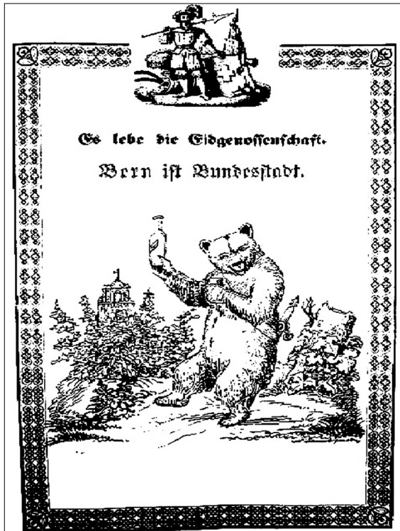
Ilustracja nr 9

Czasopismo satyryczne „Der Gukkasten” w 1849 r. zamieściło List murzyńskiego cesarza (...) do jego czarnych poddanych , w którym informuje on, że w zamian za wydanie uchodźców politycznych z Rosji, Francji i Austrii „samowładca wszystkich niedźwiedzi zamierza uhonorować [ministra Uh-Uh] orderem z knuta, do noszenia na szyi” 49 . Pod postacią „murzyńskiego cesarza” i jego totumfackich, takich jak cytowany „minister Uh-Uh” anonimowy autor epistoły widział mało światła, za to niewolniczo uległ wpływom obcych mocarstw władze federalne Konfederacji Szwajcarskiej.