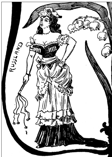
Ilustracja nr 13

[F. Boscovits, Europäische Frühjahrsmoden , „Nebelspalter“ 1900, nr 14 (fragment)]