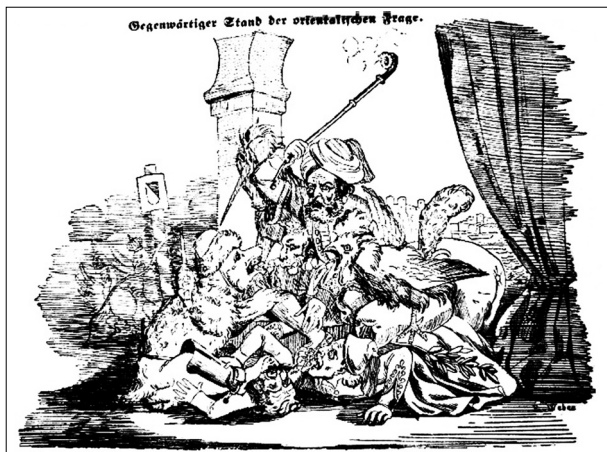
Ilustracja nr 2

[B.a., Wie der russischer Bär den in der Walachei gestohlenen Honig in Sicherheit zu bringen sucht , „Der Postheiri” 1854, nr 29]