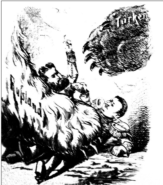
Ilustracja nr 3

Działania te służyć mają osłabieniu Turcji w wyniku walk wewnętrznych do tego stopnia, by Rosja łatwiej mogła ją następnie pokonać. Dosadniej pogląd o hipokryzji i zbrodniczych zamiarach Rosji wyraża karykatura, zamieszczona w czasopiśmie „Nebelspalter” po tym, gdy w 1877 r. imperium carów włączyło się do działań wojennych. Przedstawia ona Serbię i Rumunię, państwa po których stronie Rosja stanęła do walki z Turcją, przygniecione łapą wielkiego niedźwiedzia 20 .