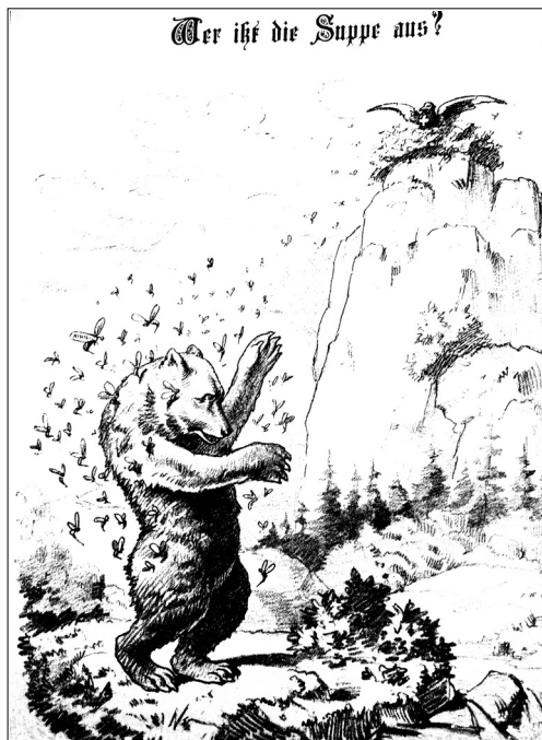
Ilustracja nr 10

[b.a., Wer isst die Suppe aus? , „Nebelspalter” 1881, nr 13, udostępnione przez Zentralbibliothek Zürich]