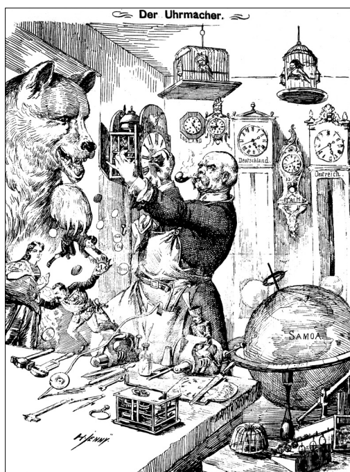
Ilustracja nr 5

13-letniego Aleksandra Obrenowicza, króla Serbii, oraz jego matkę, regentkę Natalię. Z jego łap wymyka się, gubiąc koronę, ojciec Aleksandra, Milan. Intencja karykaturzysty jest czytelna. Intrygi rosyjskie doprowadziły do kolejnych zawirowań politycznych na Bałkanach, abdykacji nazbyt samodzielnego władcy i zastąpienia go dzieckiem, w którego imieniu władzę sprawować ma sterowana przez Wielkiego Brata Rosjanka 34 . Stary kanclerz nazywa siebie „pielgrzymem w St. Just”, czyniąc aluzję do losów cesarza Karola V, który ostatnie lata życia spędził w ciszy klasztoru 35 . Całkiem trafnie, ponieważ w roku następnym przyjdzie mu odejść na polityczną emeryturę. Już teraz jednak zmuszony jest być świadkiem burzenia stworzonego przez siebie ładu przez dające przedsmak nowej polityki napierające siły chaosu.