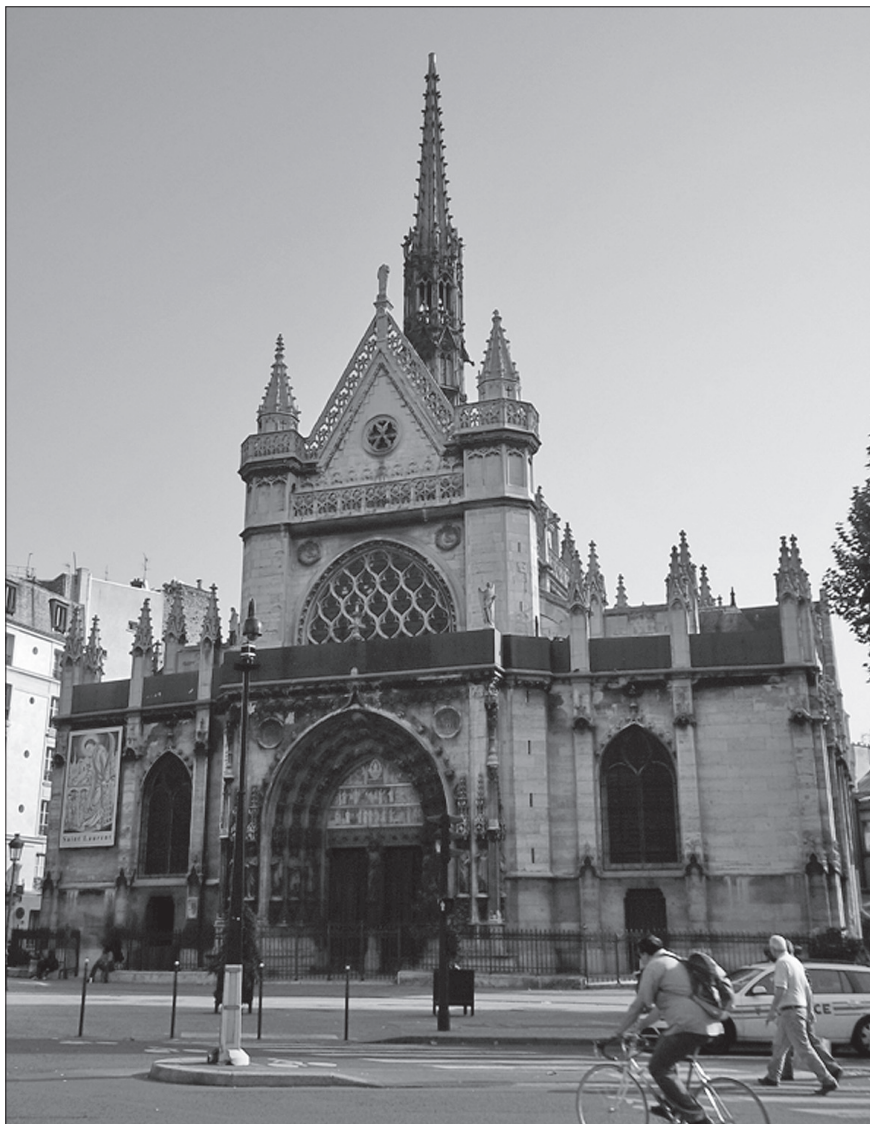
Fot. 1. Kościół św. Wawrzyńca przy ulicy Faubourg St Martin 119 w Paryżu. Na terenie parafii św. Wawrzyńca znajdowało się opactwo św. Łazarza