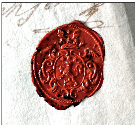
Ryc. 4. Pieczęć sygnetowa z herbem Stanisława Gabriela Węgrzynowicza z 1729 r.