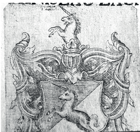
Ryc. 9. Herb Michała Więckiewicza ze stemmaty nr XVII