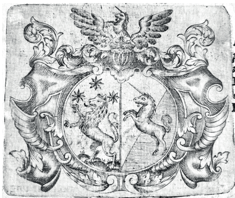
Ryc. 7. Herb Józefa Węgrzynowicza, stemmata nr XIV