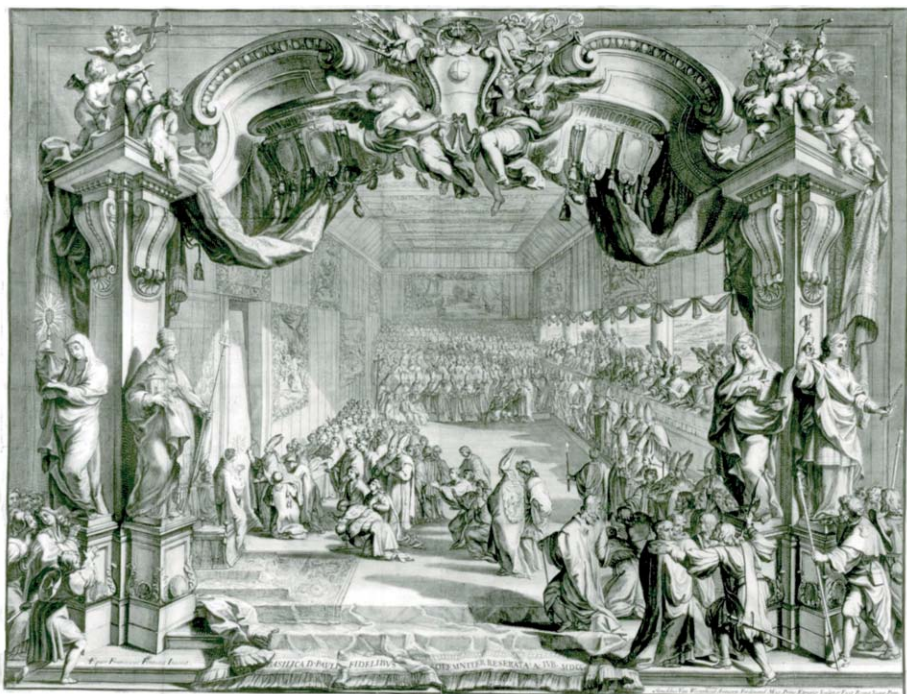
II. 1. Apertura della Porta Santa a San Paolo, Biblioteca Apostolica Vaticana, Fondo Ferrajoli, III/946, Series Sacrorum Rituum in perditione Portae Sanctae, Romae MDCCI

Szczególnymi formami podkreślającymi godność królowej były audiencje udzielane przez nią posłom oraz członkom Kurii Rzymskiej. Posłuchania odbywały się w specjalnie przygotowanej komnacie w Palazzo Odescalchi. Królowa spoczywała w łóżu przyozdobionym baldachimem 33 . W jednej z relacji była nawet mowa o tym, że marszałek dworu Marii Ka-