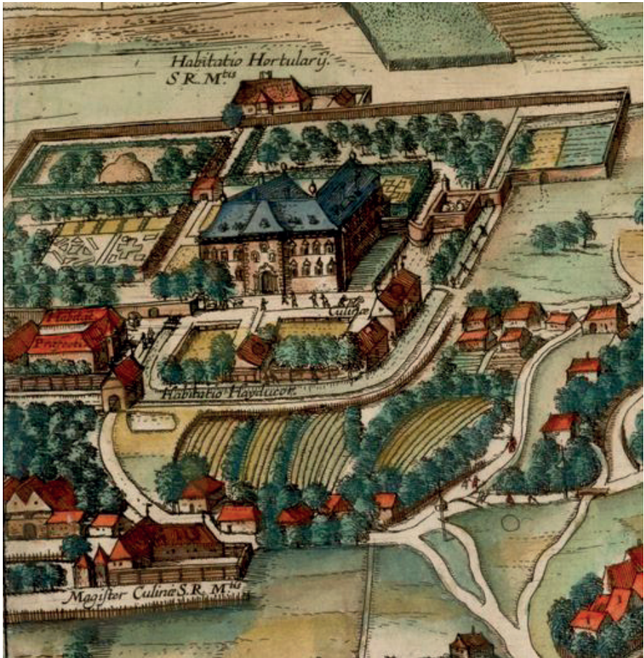
Il. 1. Rezydencja królewska w Łobzowie od południowego wschodu (fragment panoramy Krakowa z Civitates orbis terrarum ). Po lewej stronie widoczny trójskrzydłowy dom folwarczny wzniesiony w latach 1588–1589