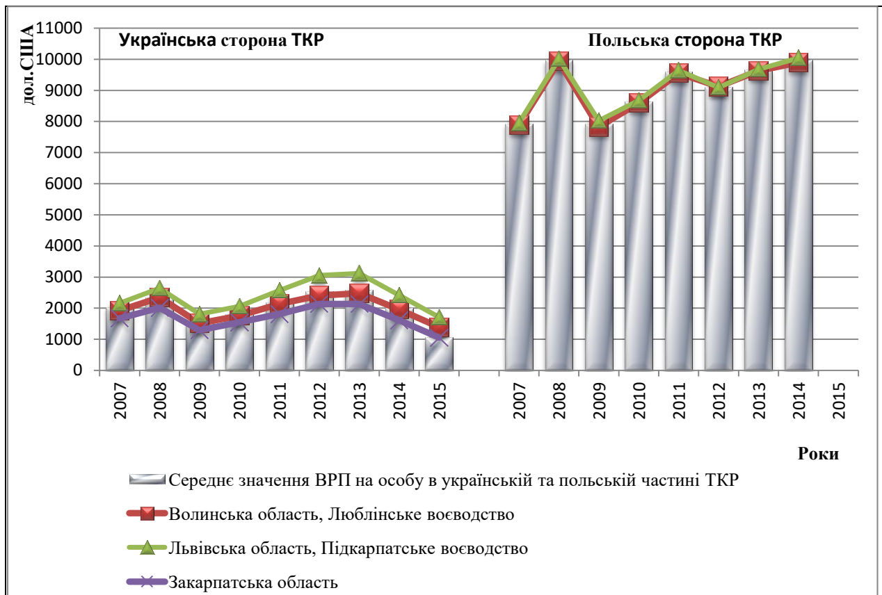
Рис. 1.1. Динаміка ВРП на одну особу в українсько-польському транскордонному регіоні за 2007–2015 роки, у дол. США.