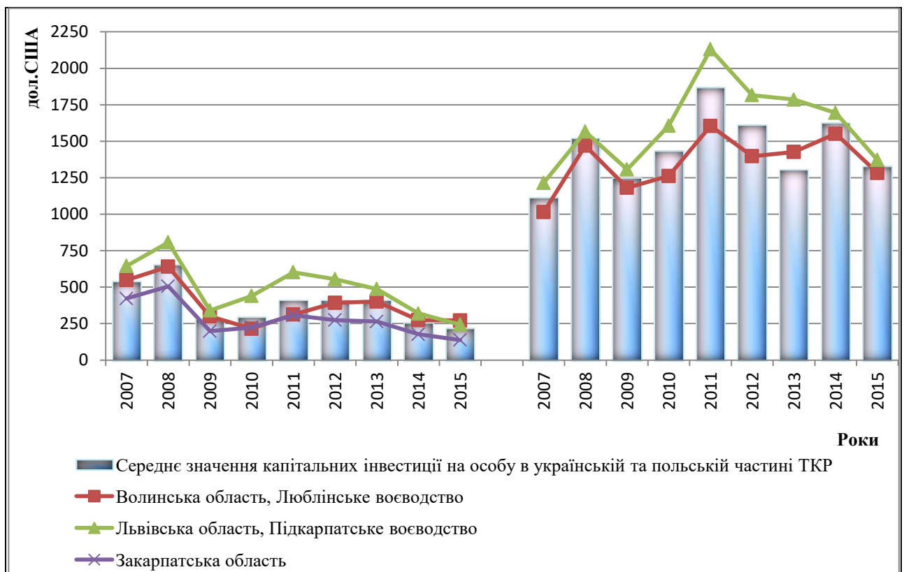
Рис. 1.4. Динаміка капітальних інвестицій на особу в українсько-польському транскордонному регіоні за 2007–2015 роки, у дол. США.

Спад інвестиційної активності призвів до падіння рівня інвестицій з розрахунку на одного мешканця (рис. 1.4). У 2015 році підприємства українського прикордоння освоїли 218 дол. США з розрахунку на одного мешканця, що на 39 дол. США/особу менше ніж у 2014 або на 15,2%. Починаючи з 2013 року капітальні інвестиції на одну особу починають різко зменшуватись аж на 189 дол. США/особу або на 46,4% у порівнянні з 2015 роком. Відхилення середнього значення капітальних інвестицій на одну особу на прикордонних територіях української частини транскордонного регіону від його середнього значення загалом по країні знизилось у 2015 році до 25,6% порівняно з 33,2% у 2007 році, але до 2014 році це відхилення було набагато вищим і становило аж 40,4% у 2014 році відповідно.