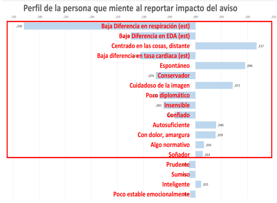
Figura 3. Perfil de personalidad de quienes mienten al reportar el impacto del aviso.

Al realizar la correlación entre las respuestas psicofisiológicas y los perfiles de personalidad, se encontró un aspecto muy interesante, relacionado con lo que podría llamarse conducta de mentir , que se presentó entre los individuos que respondieron verbalmente de manera afirmativa a la pregunta relacionada con el impacto del comercial; en tanto que la respuesta psicofisiológica se mostraba contraria a dicha afirmación.