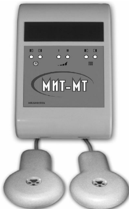
Рис. 3. Аппарат для магнитолазерной терапии многофункциональный «МИТ-МТ»

В настоящее время доказано, что биологический механизм сочетанного воздействия НИЛИ и ПМП на одну и ту же зону биологического объекта основан на суммировании и потенцировании терапевтического эффекта двух ФФ.