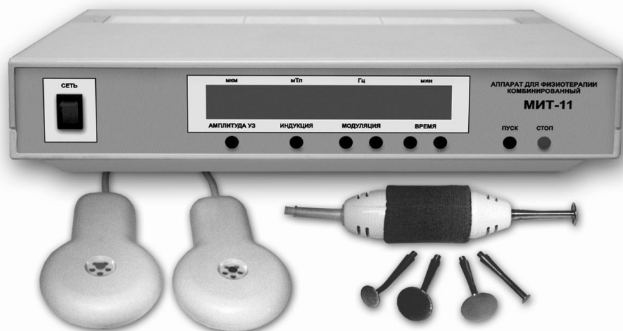
Рис. 3. Аппарат для физиотерапии комбинированный «МИТ-11», включающий возможность воздействия ПМП, НИЛИ и ультразвуком низкой частоты.

процесс восприятия и переноса энергии за пределы облучаемого участка тканей как проявление своеобразной «спектральной памяти».