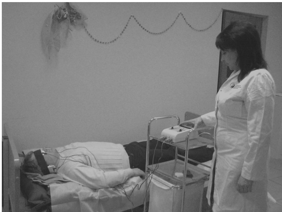
Рис. 1. Процедура проведения ЭС при ВСД по глазнично-сосцевидной методике (аппарат МИТ-ЭФ2 фирмы «Мединтех»)

* центральная электроанальгезия (ЦЭА) – метод нейровегетативной регуляции функций ЦНС. Для проведения ЦЭА используют аппаратуру серии «МИТ» по лобно-сосцевидной методике.