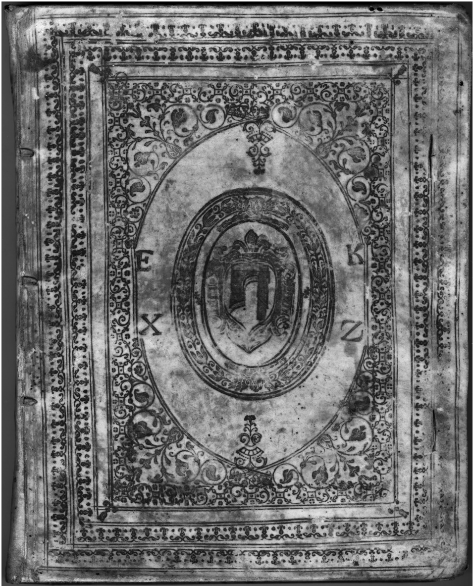
Ilustracja 1. Górna okładzina oprawy krakowskiego druku z 1652 r.