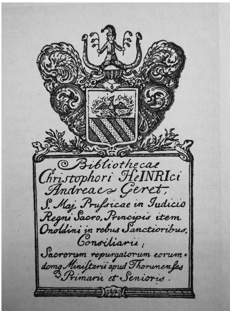
Exlibris Krzysztofa Gereta (Z. Mocarski, Exlibris łowicki O.O. Bernardynów, jego właściciel. Exlibrisy Toruńskie (urywek), Toruń 1947, s. 41.).

Pod herbem znajduje się tablica ozdobiona w górnych rogach głowami pie-sków i liśćmi lauru. Na tablicy widnieje napis: „Bibliothecae Christophori HeINRici Andreae Geret, S[acrae] Maj[estatis] Prusicae in Judicio Regni sacro, Principis item Onoldini in rebus Sanctoribus, Consiliarii, Sacrorum repurgatorum eorumdemque Ministerii apud Thorunenses Primarii et Senioris”. Na szczególną uwagę zasługuje wyróżnienie w imieniu HeINRici liter I.N.R.I. (Jesus Nazareus Rex