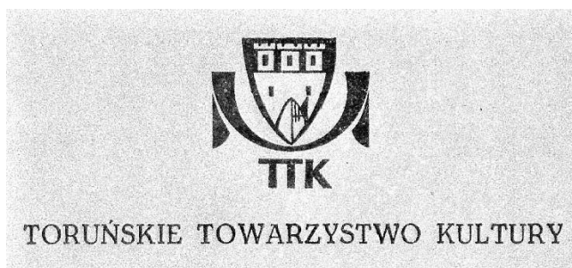
Sygnet wydawniczy TTK

Każdy tomik serii otrzymał własną, ale utrzymaną w stylu serii okładkę ochronną. Jej przestrzeń podzielono na dwa pola wypełnione kontrastowymi kolorami (np. czarny i czerwony w nr. 1, żółty i zielony w nr. 4). Górne, nieznacznie większe (11,5 cm wysokości 61 ), przeznaczono na ilustracje tematycznie nawiązujące do treści publikacji. Na przykład na okładce pracy K. Ciesielskiej Herb i pieczęcie miasta Torunia zamieszczono reprodukcję emblematu znad wejścia do apteki Rady Miejskiej w Toruniu, który zaginął w czasie drugiej wojny światowej 62 , a na okładce Wspomnienia o Toruniu... J. Serczyka wykorzystano fotografię, autorstwa Janiny Gardzielewskiej, medalu wybitego z okazji obchodów siedemsetlecia Torunia 63 . Dolna część obwoluty (wysokości 8,5 cm) pełniła funkcję informacyjną. W tym polu umieszczano tytuł danej pracy złożony Antykwą Toruńską oraz element graficzny traktowany jako znak serii. Na tej samej wysokości na dolnej okładce widnieje sygnet wydawniczy TTK wraz z pełną nazwą Towarzystwa. Skrzydełka obwoluty pozostawały jednolicie białe. Tylko w trzech tomikach (nr 5–6 i nr 12) wydrukowano na nich krótkie teksty informujące o serii.