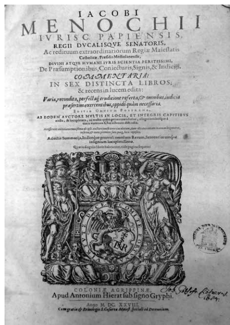
Karta tytułowa książki G. Menochia De praesumptionibus coiecturis... (Kolonia 1628) z podpisem J. G. Rösnera. Repr. za: WBP-KK, sygn. 5621