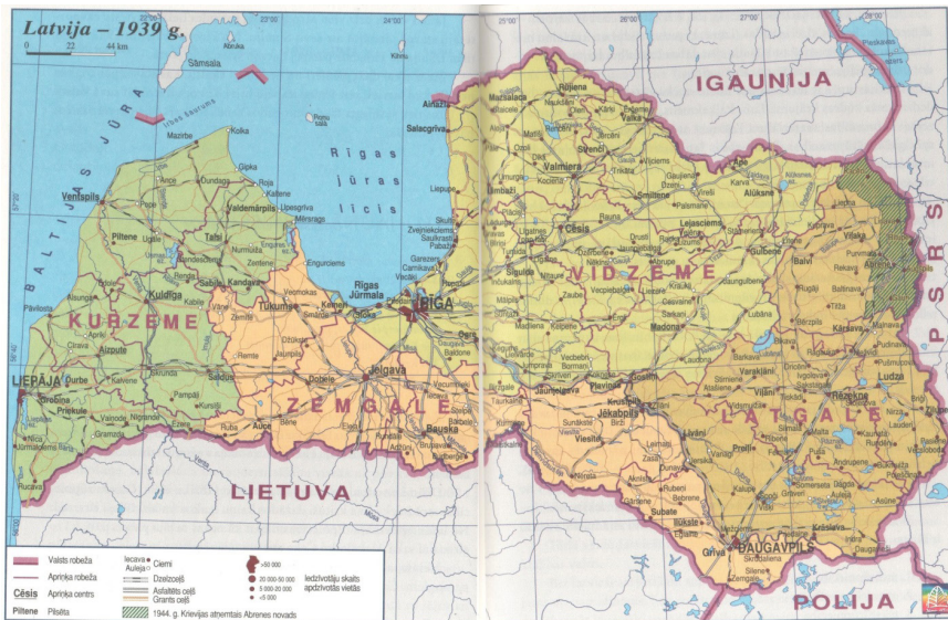
Рис. 2. Карта Латвии 1939 года