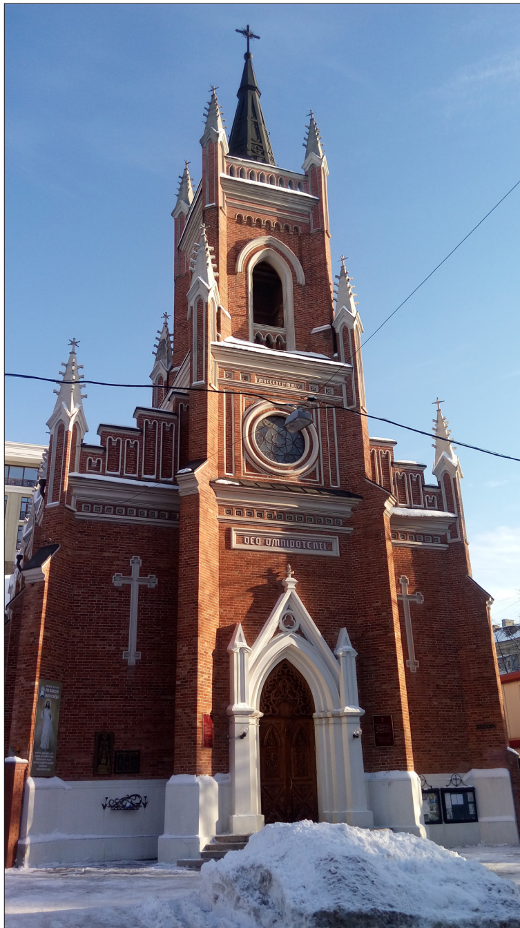
Fot. 5. Kościół w Charkowie