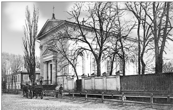
Fot. 2. Kościół w Połtawie