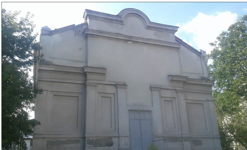
Fot. 1. Kościół w Cernihowie