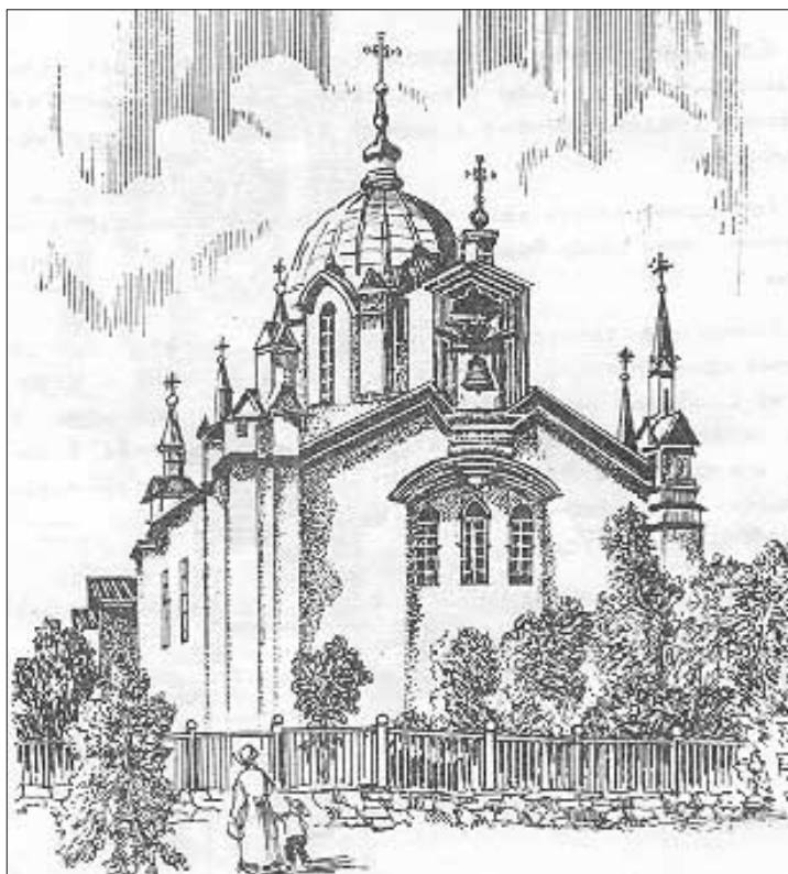
Fot. 3. Kościół w Mariupolu