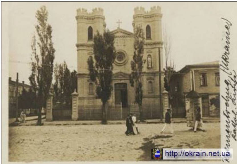
Fot. 7. Kościół w Krzemieńczuku