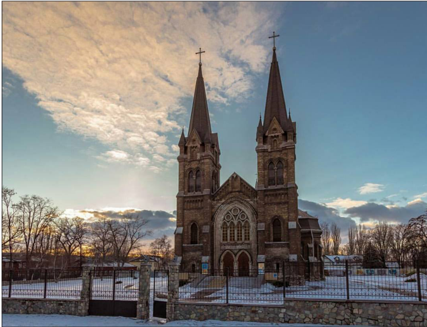
Fot. 6. Kościół w Kamiansku