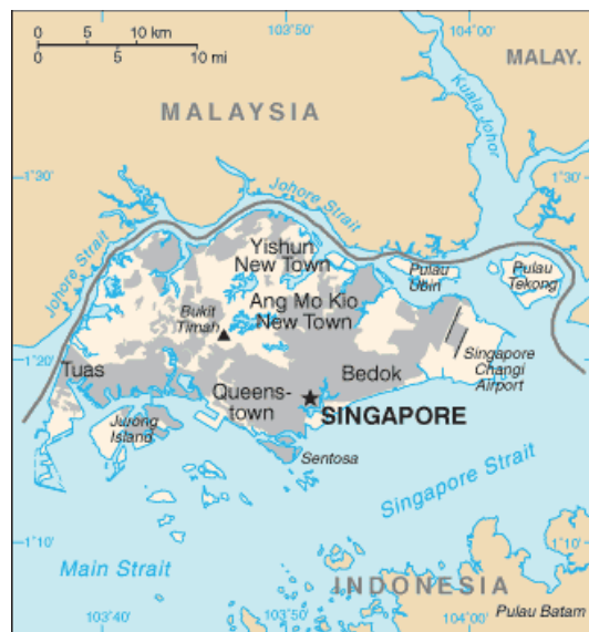
Mapa 1. Mapa współczesnego Singapuru