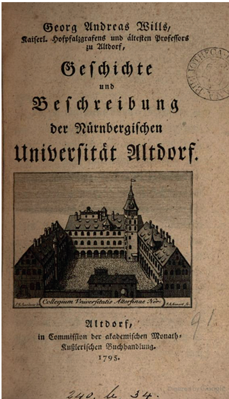
Bild 2: G. A. Will, Geschichte und Beschreibung der Universität Altdorf , (1795). Bildnachweis: Universitätsbibliothek Erlangen-Nürnberg [zu S. 69–75]