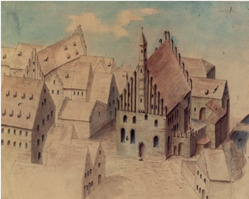
Bild 9: Hohe Schule und Collegium Georgianum der Universität Ingolstadt 1571.