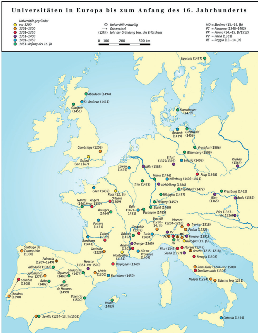
Bild 1: Europas Universitäten bis zum Beginn des 16. Jahrhunderts. Bildnachweis: Haak Geographischer Atlas, (1979)