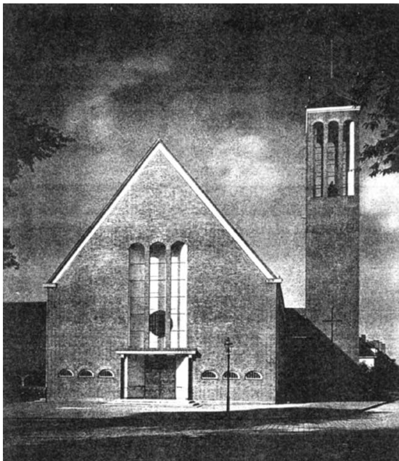
5. Kirche in Königsberg-Ratshof (Kaliningrad), Entwurf K. Frick. Quelle: Die Kirche in Ratshof bei Königsberg , „Zentralblatt der Bauverwaltung vereinigt mit »Zeitschrift für Bauwesen«“, 58, 47 (1938), S. 1259–1266