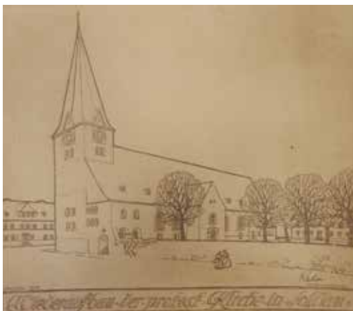
2. Kirche in Dziadowo (Soldau), Entwurf P. Kahm.