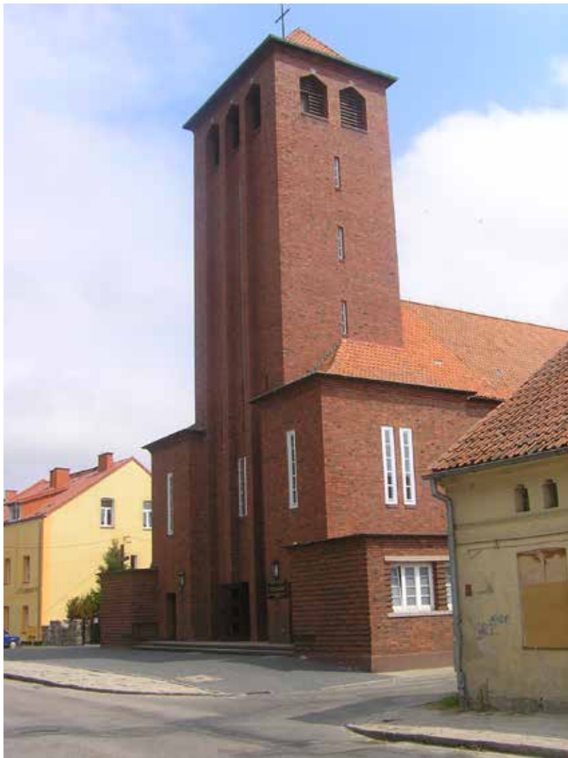
4. Kirche in Węgorzewo (Angerburg), Entwurf P. Just.