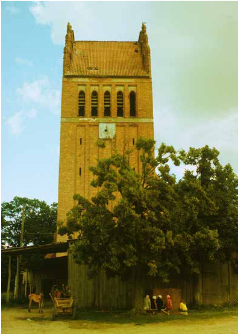
1. Kirche in Allenburg, Entwurf A. Kickton.