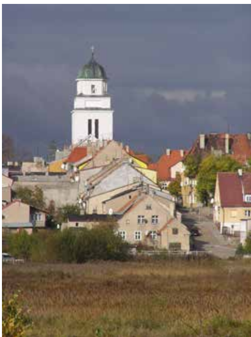
3. Kirche in Dziadowo (Soldau), Entwurf P. Pitt.