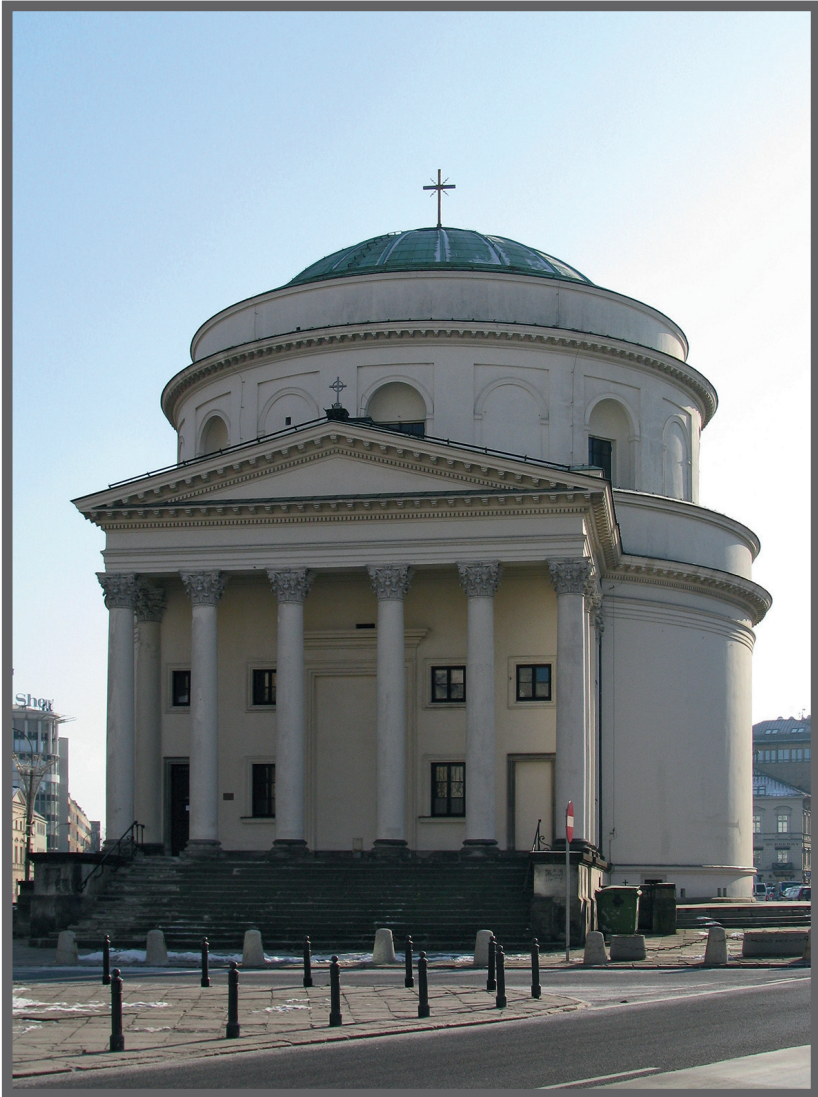
Abb. 6. Die Alexanderkirche