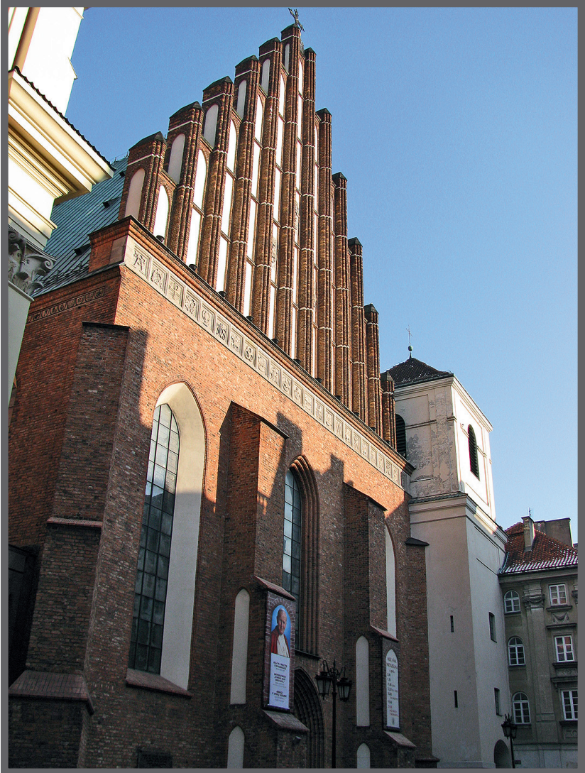
Abb. 2. Die Fassade der Johanneskathedrale, Entwurf von Jan Zachwatowicz