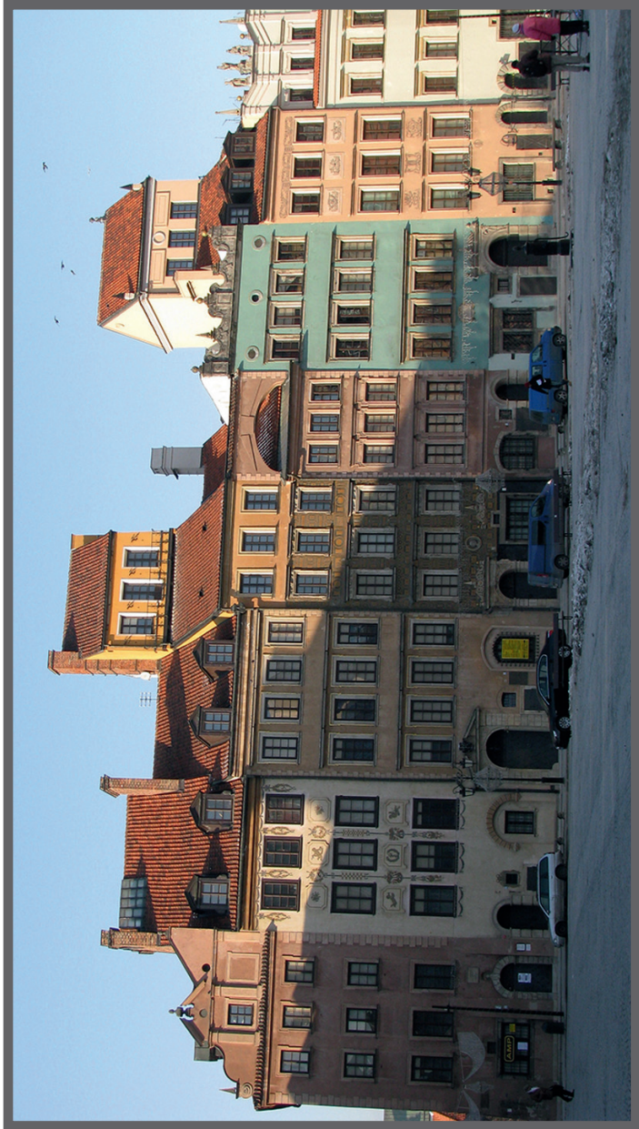
Abb. 1. Ansicht der nördlichen Marktseite