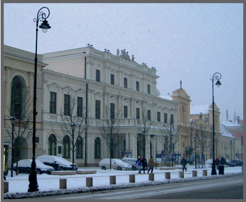
Abb. 4. Die Krakowskie-Przedmieście-Straße