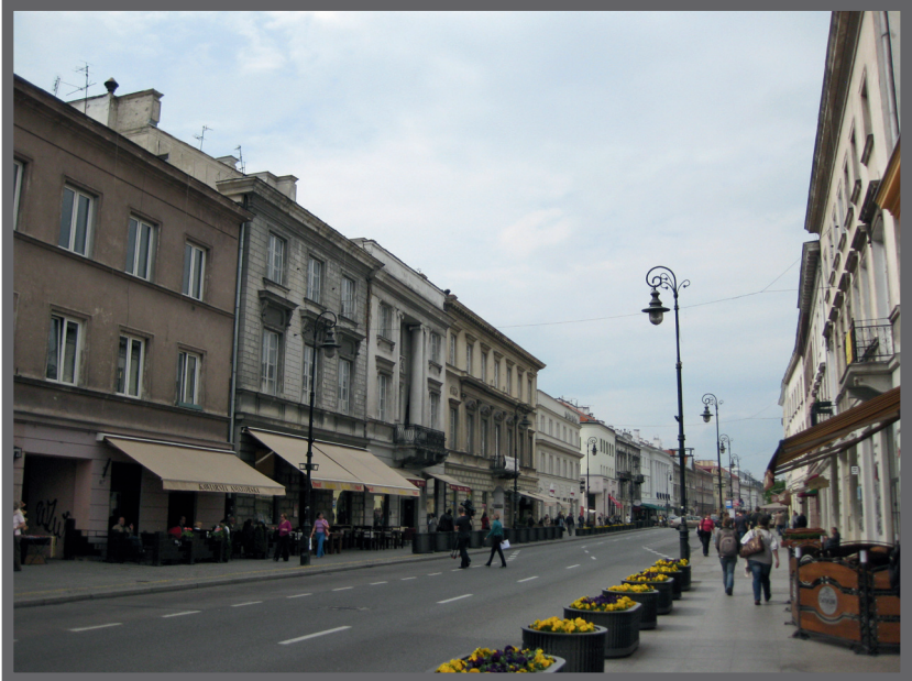
Abb. 5. Die Nowy-Świat-Straße