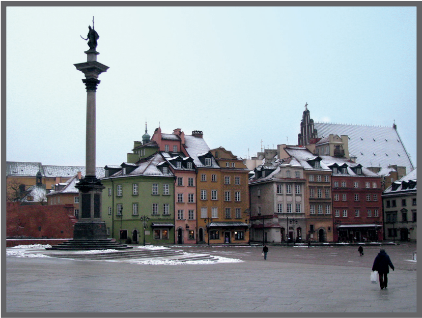
Abb. 3. Der Zamkowy Platz in der Altstadt mit Johanneskathedrale im Hintergrund