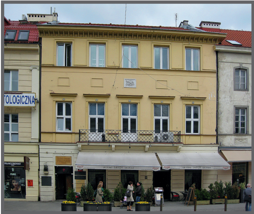
Abb.7 Die Nowy-Swiat-Straße 55, heutiger Zustand