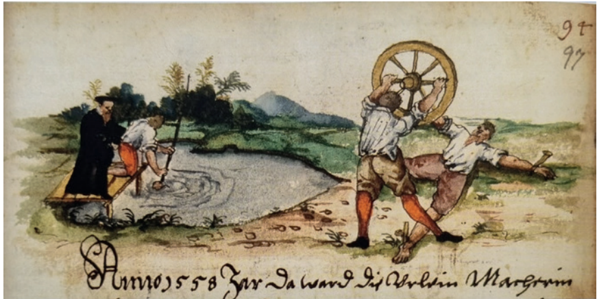
Abb. 1: Ertränkungs- und Räderszene im Strafverfahren gegen die Uhrmachersfrau Anna Schellhammer und ihren Gesellen Adam Linz.