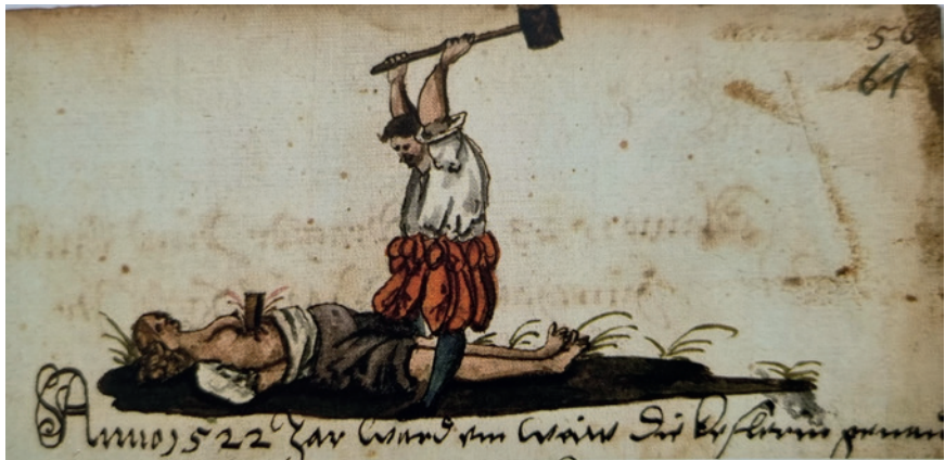
Abb. 2: Elsbeth Komenther wurde nach „gütlichen“ und „peinlichen“ – „ir wee thun lassen“ – Verhören am 10. Juli 1522 gepfählt und anschließend „lebendig“ begraben.