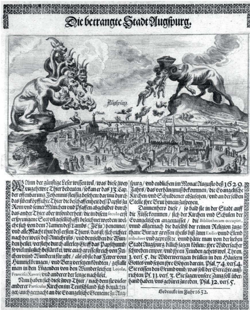
Abb. 2: Das paritätische Modell führte nicht zu der erhofften Religionsfreiheit, sondern blieb ein starres Verfassungsgebilde, das im Dreißigjährigen Krieg erneut von Konfessionsgegensätzen überschattet wurde. Kupferstich: Die betrangte Stadt Augspurg , 1632.