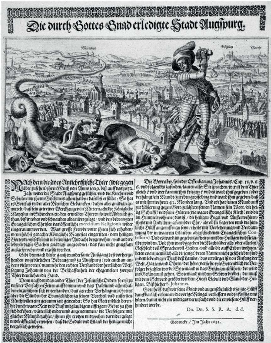
Abb. 3: Gustav II. Adolf, König von Schweden, vernichtet nach seinem siegreichen Kriegs- und Glaubensfeldzug die „papistische Abgötterei“ in Augsburg. Kupferstich: Die durch Gottes Gnad erledigte Stadt , 1632.