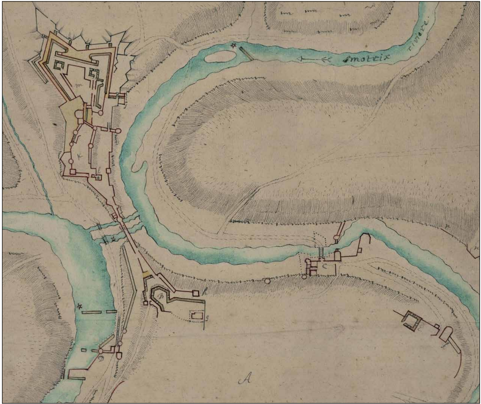
Ryc. 5. Plan Jeana/Jacques'a de Bonnelevay'ego (fragment).