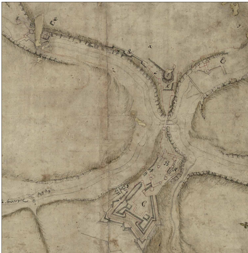
Ryc. 6. Plan Jana de Wittego – warszawski (fragment).

Dzieło o wymiarach 355×450 mm opatrzone jest podziałką liniową w sążniach ( toises ) oraz różą wiatrów. Wykonane zostało w skali ok. 1:5000 i orientacji wschodniej. Jak dotąd wspomniane było w polskim piśmiennictwie przez Jacka Czubińskiego i Justynę Tucholską 65 , a w literaturze ukraińskiej – przez Jarostawa Matwijiszyna 66 . Fakt, że autor planu podpisał się na nim jako porucznik, każe datować powstanie dzieła między 1734 i 1735 r. Jak podają