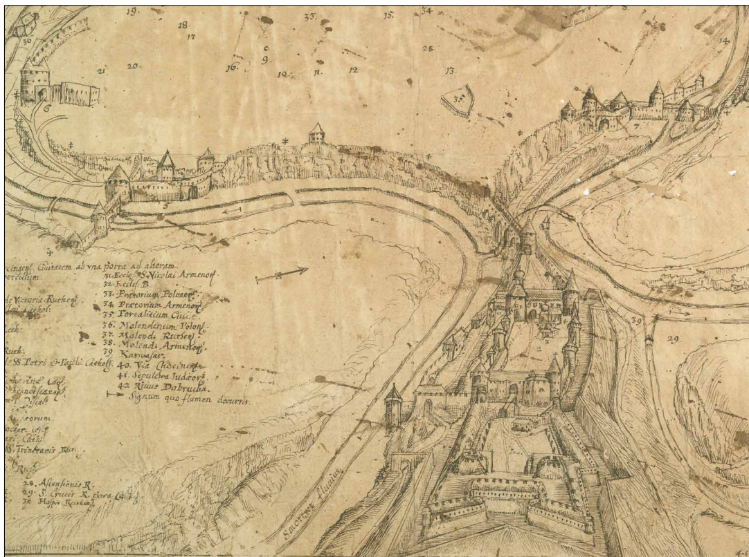
Ryc. 1. Plan miasta i zamku w Kamieńcu Podolskim (fragment).