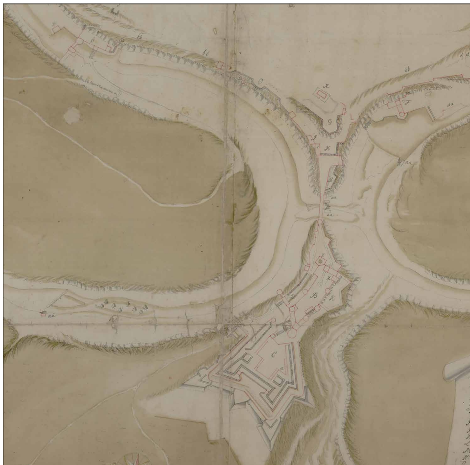
Ryc. 7. Plan Jana de Wittego – petersburski (fragment).