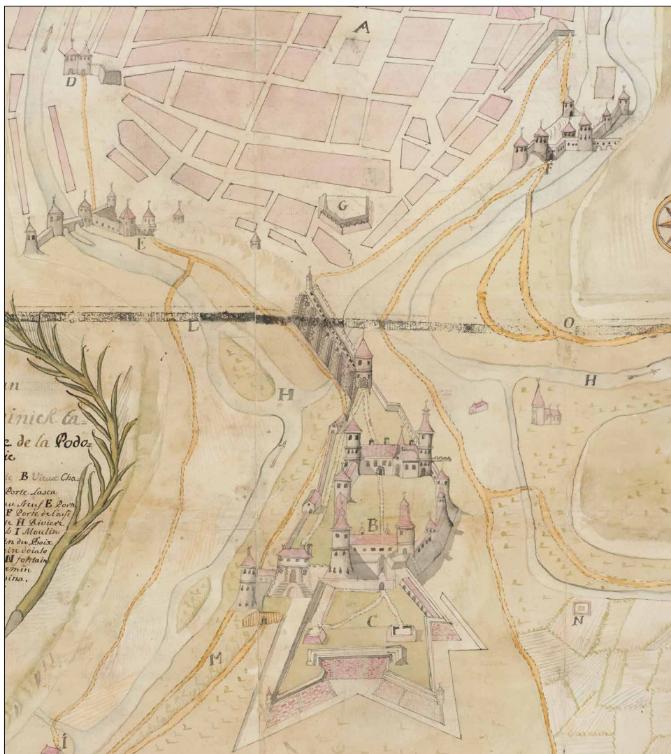
Ryc. 3. „Plan de Kamienieck Capitale de la Podolie” (fragment).

E) Porte de Rusy [‘Brama Ruska’ – w rzeczywistości Brama Polska] / F) Porte de Cossi [‘Brama Kozacka’ – w rzeczywistości Brama Ruska] / G) Redoute [‘Szańiec Miejski’] / H) Riviere Smotrich [‘Rzeka Smotrycz’] / I) Moulin [‘Młyn’] / L) Chemin du Boix [‘Droga dylowana’] / M) Chemin doialo Village [‘Droga do miasta’] / N) Fontain [‘Źródło’] / O) Chemin de Chotsina [‘Droga do Chocimia’]”.