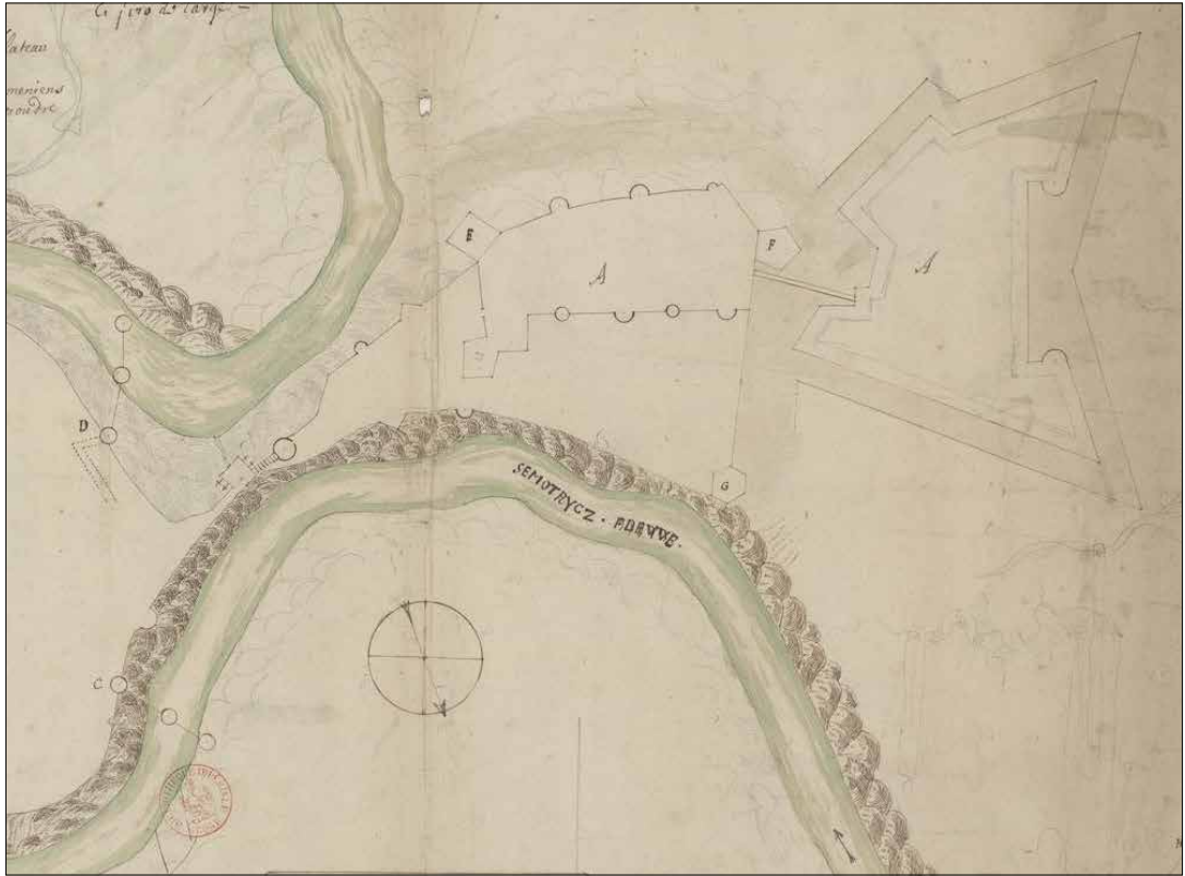
Ryc. 4. Plan Darcy'ego (fragment).