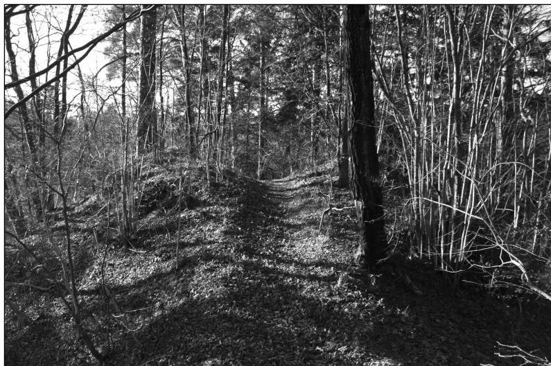
Fot. 1. Widok na relikty bramy wjazdowej grodziska Sądyty

i wiele fragmentów wczesnośredniowiecznej ceramiki 33 . Niewątpliwie do dokładnej weryfikacji tego miejsca skłonił mnie przede wszystkim znak na mapie Hennenbergera. Uważa-