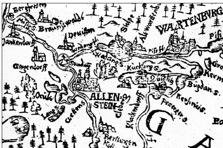
Ryc. 4. Fragment mapy Kaspara Hennenbergera przedstawiający okolicę Olsztyna. Na północ od miasta zaznaczono sygnaturą grodzisko Sądyty (Sanditten)