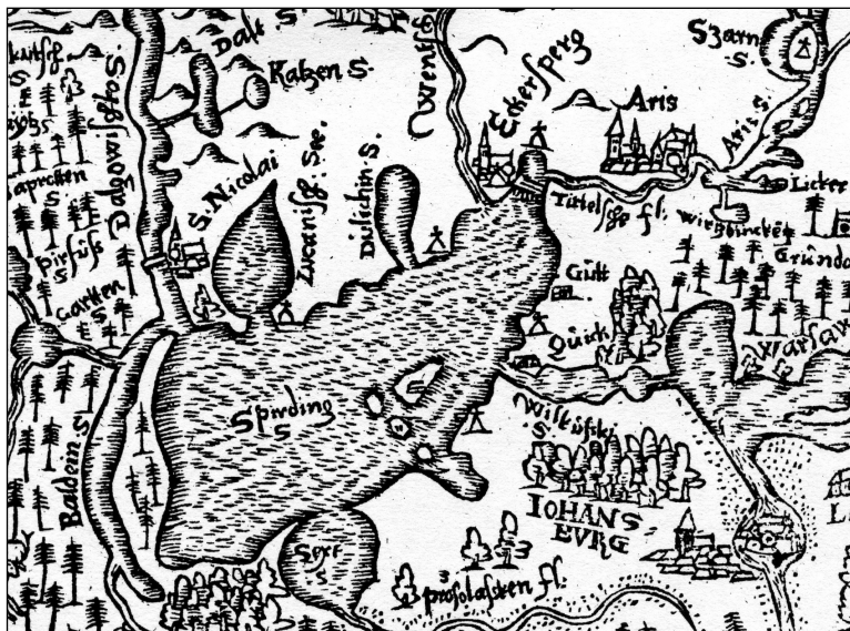
Ryc. 1. Fragment mapy Kaspara Hennenbergera „Prussiae, das ist das Landes zu Preusse” z 1576 r. – okolica jeziora Śniardwy z zaznaczonymi sygnaturami

relikty założeń obronnych w pobliżu następujących miejscowości: Łuknajno, Tuchlin, Okartowo, Tyrkło, Nowe Guty, Kwik oraz Zdory. Obiekt w Okartowie był ruiną zamku krzyżackiego, ostatecznie zniszczonego przez