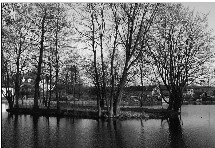
Fot. 3. Wyspa na Stawie Młyńskim w Pilcu – przypuszczalne relikty średniowiecznej strażnicy

w 1374 r. pozostawała pod jurysdykcją biskupa warmińskiego 47 . Według dokumentu z 24 czerwca 1369 r. granica dominium warmińskiego przebiegała blisko zamku w Pilcu: „ad granicam positam retro Resel iuxta castrum Piltcz”. Następnie dokument szczegółowo określa jej przebieg: „Item ab alia parte retro Resel a granica posita circa Piltcz per Seysten ad lacum Kerwoyke et fluuium qui ab eo fluit, et habet in longitudine viij miliaria” – granica przebiegała od Reszła obok Pilca przez Szestno do Jeziora Kierwik i rzeki, która z niego wypływa. Łączna długość linii granicznej wy-