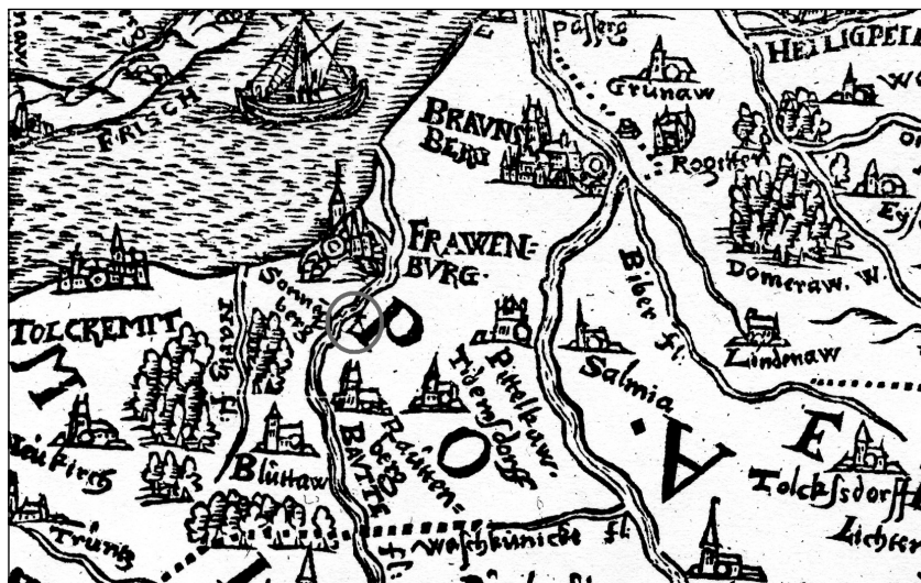
Ryc. 6. Fragment mapy Kaspara Hennenbergera przedstawiający okolicę Fromborka. Widać Frombork od strony południowej oraz grodzisko w Bogdanach (Sonnenberg)