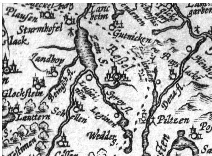
Ryc. 8. Fragment mapy Abrahama Orteliusa „Prussiae vera descriptio” z obiektami w Pilcu i Pleśnie