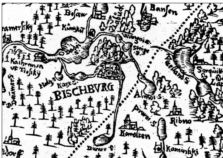
Ryc. 3. Fragment mapy Kaspara Hennenbergera przedstawiający okolicę Biskupca. Po prawej stronie kartograf zaznaczył dwa grodziska – tzw. kopce wartownicze (Stary Gieląd i Młynik) już spoza obszaru Warmii

Akt ten zawiera kolejną interesującą informację – otóż zezwolono mieszczanom na budowę w obrębie miasta, naprzeciwko obwarowań i palisady, wieży obronnej 25 . Zamek nie przetrwał długo. Zniszczony podczas wojny trzynastoletniej nie podźwignął się już z ruin. W literaturze przedmiotu istnieje hipoteza, jakoby zamek w Biskupcu miał stać na północnym brzegu rzeki Dymer, naprzeciwko kościoła, ale już poza murami miejskimi 26 . W latach 1992–1997 na terenie Biskupca prowadzono prace archeologiczne, podczas których przebadano także obszar, gdzie rzekomo miały znajdować się pozostałości zamku. W świetle przeprowadzonych badań archeolodzy nie znaleźli relikwów takiej budowli, a jedynie pozostałości wczesnonowożytnych pochówków 27 . Wszystko wskazuje zatem, że w tym miejscu nie było żadnych obwarowań, a jedynie stary cmentarz, który znajdował się już poza bramą i murami miasta. Przyjrzyjmy się zatem mapie Hennenbergera. Kartograf zaznaczył kopczyk w północno-wschodniej części miasta, przy południowym brzegu rzeki Dymer i w obrębie obwarowań miejskich. Jest to całkiem inne miejsce od proponowanego dotąd w literaturze. Na podstawie własnych obserwacji terenowych