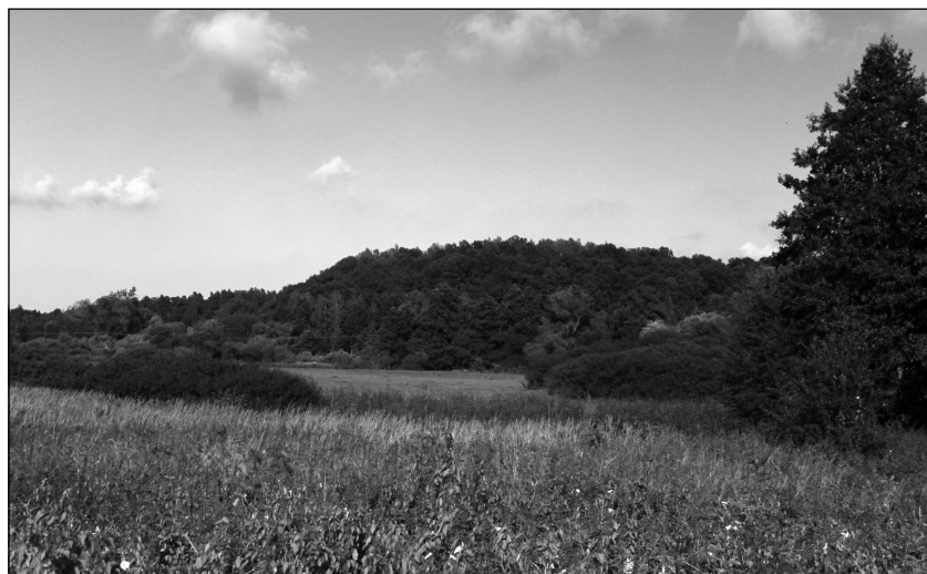
Fot. 2. Widok na grodzisko w Bogdanach od strony południowo-zachodniej