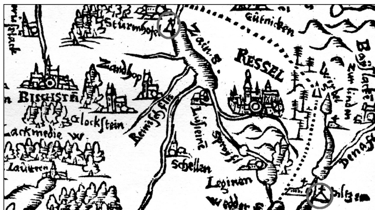
Ryc. 7. Fragment mapy Kaspara Hennenbergera przedstawiający okolicę Reszla. Na mapce przedstawione są sygnatury przy obiektach w Pilcu (Piltzen) i Grzędzie-Pleśno (Sturmhofel). Warto zwrócić uwagę na wizerunki kościołów w Uniszewie (Glockstein) i Sątopach (Santhopen), są bowiem identyczne ze współczesnymi

Kolejny kopczyk na terenie Warmii biskupiej Kaspar Hennenberger zaznaczył na zachodnim brzegu jeziora Sajno, na zachód od Reszla. Znak ten był powielany na nowożytnych przeróbkach jego map 43 . Miejsce owo położone jest w pobliżu wsi Pleśno ( Plößen )